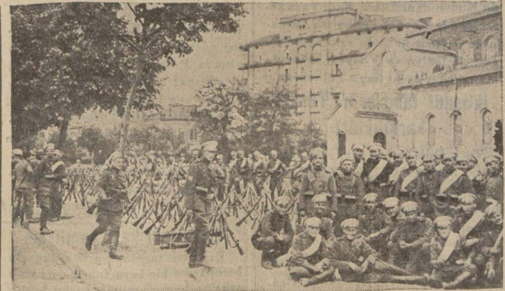
Yeni kabinein idareyi ele aldığı gün Sofya sokaklarının manzarası: Sofya şehri işgal eden askerî kıl'ardan biri

Kahire 24 (A.A.) — Hicaz kıtâatı Yemenlilerin mütareke ahkâmına riayet etmediklerini ileri sürdüklerinden, Arabistanda muhasamat yeniden başlamıştır.