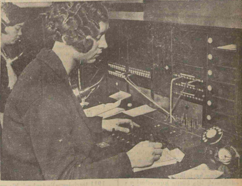
Telefonunuzu 01, 03 ve 05 i aradığınız vakit karşılaştığınız memurler iş başında

Hariçte mükâleme 15 kuruşken 10,5 kuruş oldu, senelik 550 mükâleme ücreti 25 liraya indi