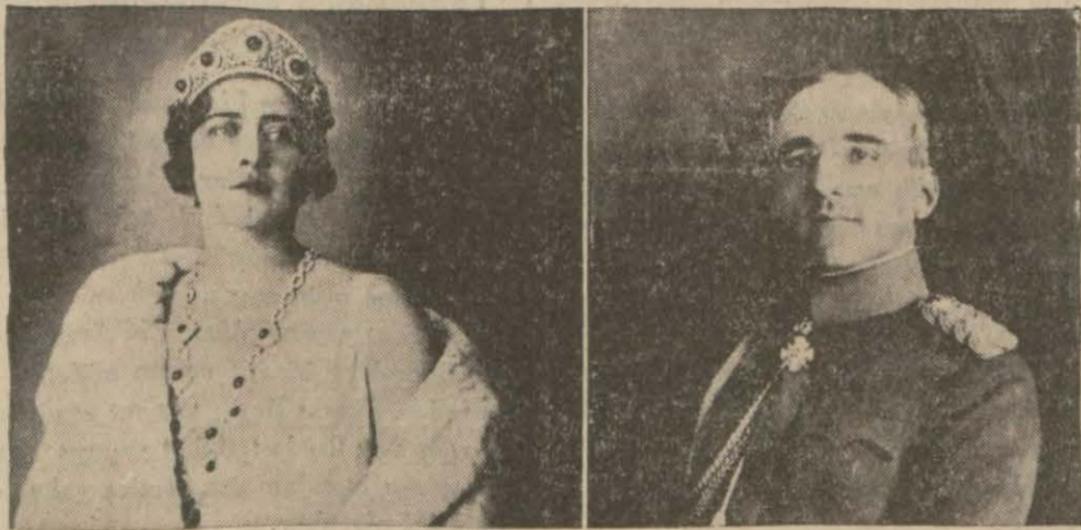
Dün Sofyayı teşrif eden Yugoslavya Kral ve Kraliçesi Hazerati

Dost memleketin hükümdarları Sofyada büyük merasim ve tezahüratla istikbal edildiler