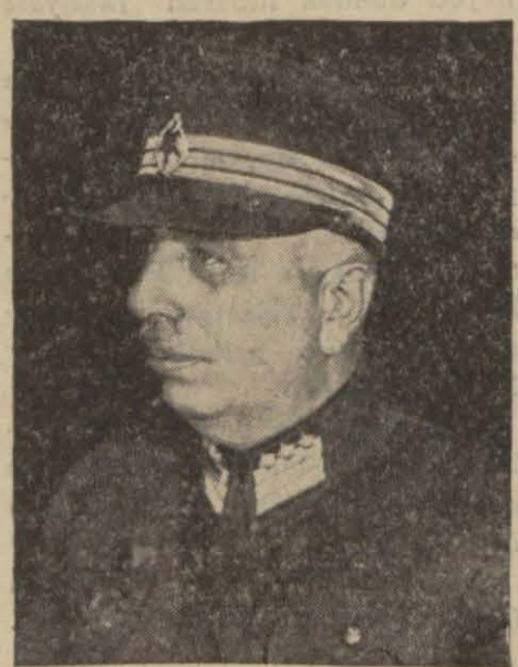
Ordu müfettişi Fahrettin Paşa

Bakırköy fırka merkezinin bastırıldığı ve cidden bu işler için bir nümune olmağa lâyık olan programda köylüye kanunun öğretmediği şeyler en küçük