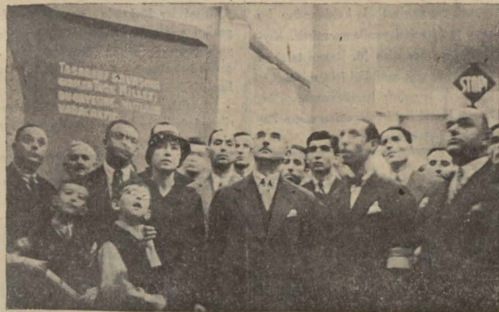
Ismet Paşa Hazretleri İş Bankası sergisini ziyaret ediyorlar

Başvekilimiz sergiyi takdir ederek «20 nci yılda daha yüksek grafikler isteriz!» dedi