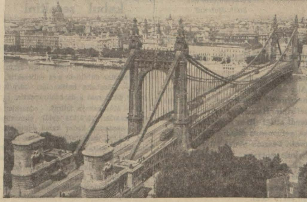
Budapeşteden muhteşem bir görünüş: Elizabet köprüsü ve şehir

Bir buçuk milyonluk kütleyi ikiye bölen Tuna şehri ayırmıyor, bağrında yatıyor gibi.