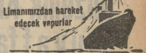
Limanımızdan hareket edecek vapurlar

İdaremez ihtiyacı için Pazarlıkla 20,000 sandık mukabili (259) metre ve (410) desimetre mik'abı kesilmiş tahta satın alınacaktır. Taliplerin şartname ve nümuneleri gördükten sonra pazarlığa iştirak etmek üzere % 7,5 teminat akçelerini hamilen 18/2/933 cumartesi günü saat 15 te Galata'da Alım satım komisyonuna müracaatleri.