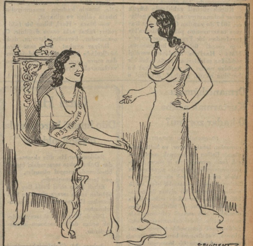
Keriman Halis — Üzülme güzelim, ben Türkiye Kraliçesi ilân edildiğim vakit te aynı dedikoduları yapmışlardı.