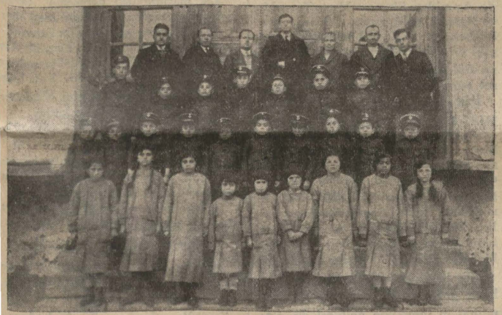
Ereğli yetim ve fakir çocukları himaye cemiyetinin giydirdiği çocuklar

«Hususi» — İki sene evvel kazamızda teşekkül eden fakir ve yetim çocukları himaye cemiyeti memleketimizde mevcut olan elli mütevaciz kimsesiz çocukların işe, tahsil ve elbiselerini temin suretinde istikballerini temin etmiş bulunmaktadır. Masarifi halkımızın muavenet ve himayetine istinat eden bu çok feyizli yar-