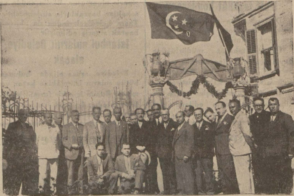
Aziz Mısırlı misafirlerimizin şerefine dün Yeniköyde verilen ziyafetten bir intiba

Türk Cumhuriyetinin on sene sürümüne iyyeğini iddia edenlere güzel bir cevap