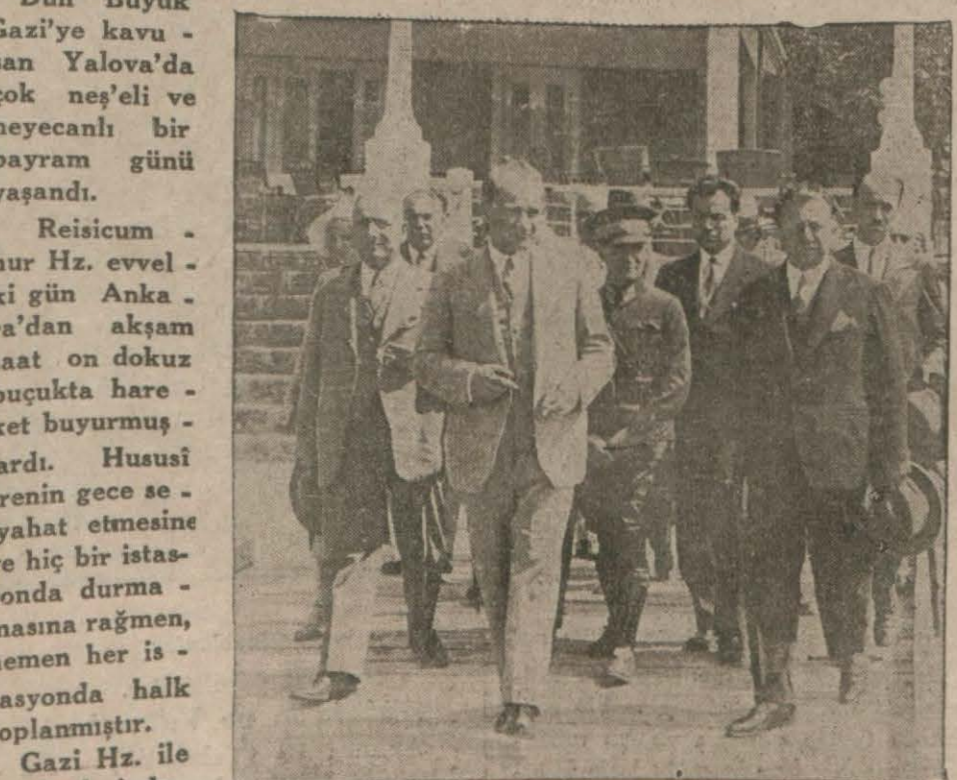
Reisicumhur Hz. kaplıcalarda

Reisicumhur Hz. ni Derince'de istikbal etmişler ve Ertuğrul yatına kadar teşvî etmişlerdir. Yalova'daki sürür ve heyecan Yalova, daha evvelki günden itibaren (Mabadi 6 inci sahife)