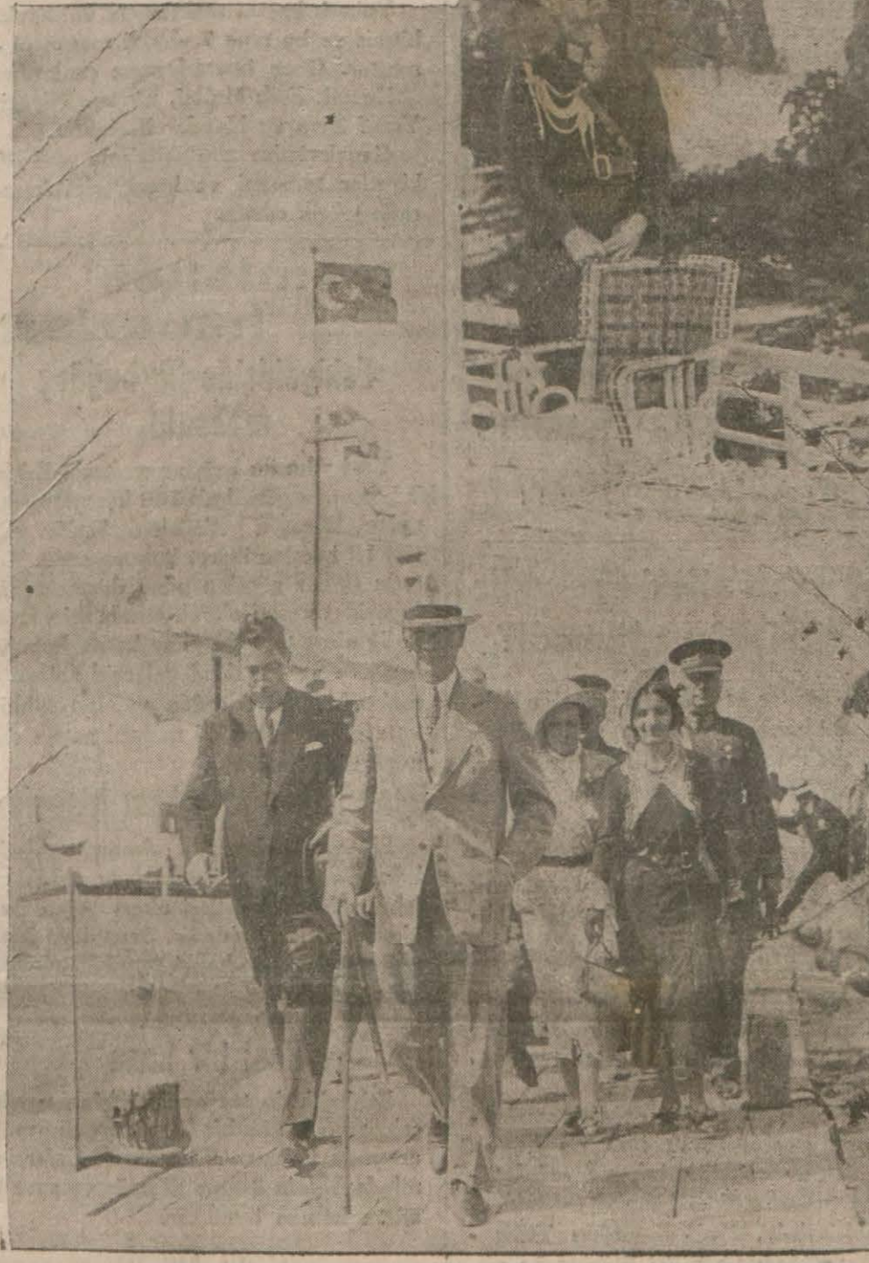
Yukarıda Gazi Hz. Baltacı çiftliğinde istirahath buyuyorlar, aşağıda çiftliğin iskelesine çıkarken

Gazi Hz. saat 3 te Millet çiftliğini, müteakıben kaplıcaları teşrif ettiler Yalova dün her taraftan gelmiş Gazi'ye mütehassir binlerce halkın sevinç tezahürleri arasında çalkandı