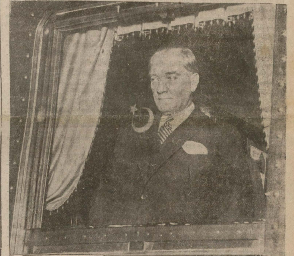
Gazi Hz. vagonlarının penceresinde

Gazi Hz. Haydarpaşa garında çok merasimle teşyi edildiler