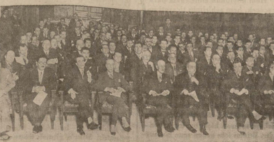
Galatasaray mezunlarının dünkü ilk kongresinde bulunanlar

Galatasaray lisesi mezunları birliği dün mekteplerinin konferans salonunda bir kongre aktetmiştir. Bu içtimada evvelâ birliğin nizam-namesi etrafında görüşülmüş ve komisyon tarafından hazırlanan nizam-name, bazı müzakerelerden sonra kabul olunmuş ve badehu idare heyeti intihabı yapılmıştır.