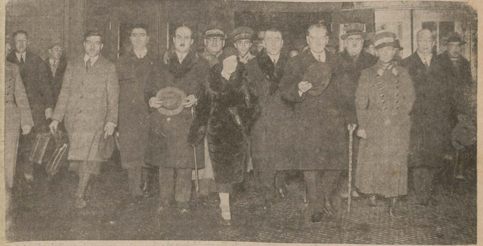
Reisicumhur Hz. ve maiyetleri erkânı Haydarpaşaya girmek üzere

Mareşal dün geceyi vapurda geçirmiştir. Vapur bugün saat on birde limanımızdan ayrılacaktır.