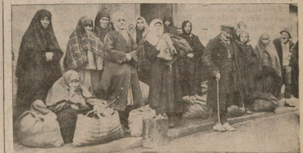
Topkapı Fikaraperver müessesesinden kömür alanlardan bir grup

Topkapı fikaraperver müessesesi, kendi muhitinde ve kendi himayesinde bulunan iki yüz fakir aileye dün kömür tevzi etmiştir. Müessesenin bu sene yalnız üç bin okka kömürü mevcut olduğundan, muhtaç oldukları tesbit edilen bu iki yüz aileye on beşer okka kömür verilmiştir.