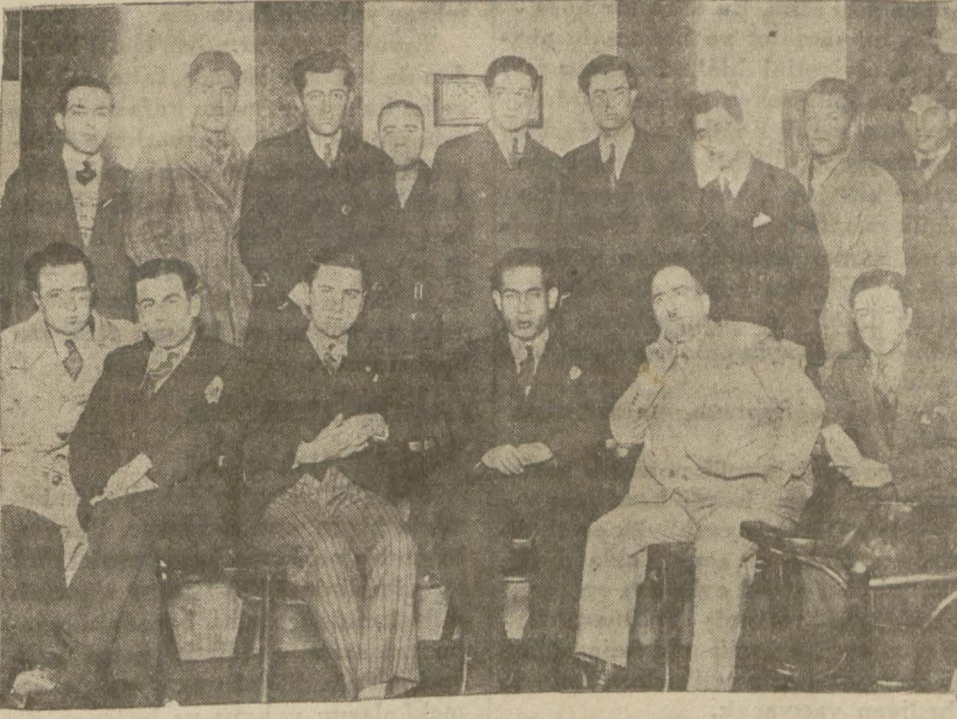
Hukuk talebesinin dünki kongresinden bir intihap

Hâkimlikle avukatlığın ayrılacağı haberi talebeyi tereddüde düşürdü