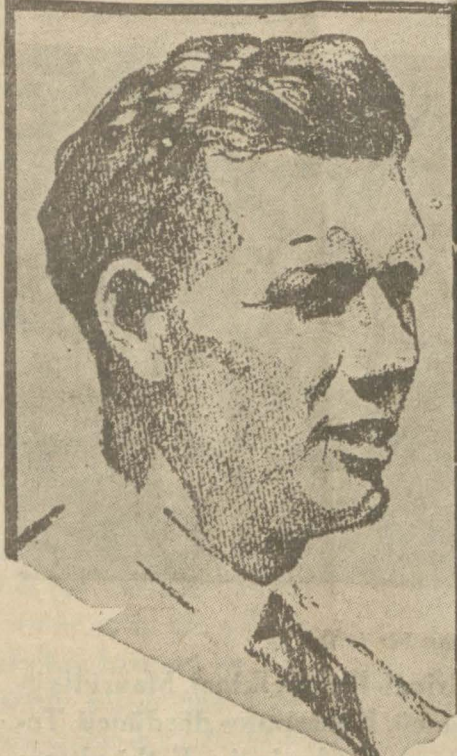
Çocuğünün kaçırılması bütün Amerika'yı meşgul eden tayyareci Lindberg

Sabık nazır, hemen her gün bir çok şahsi dostlarını kabul etmektedir.