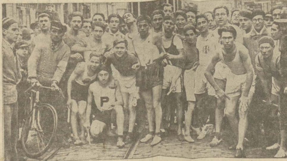
Dünkü sokak koşusundan bir intifa

Lik maçları tehir edildiklerinden dolayı büyük spor hareketleri yalnız voleybol şampiyonası ile bir sokak koşusuna inhisar etmiştir.