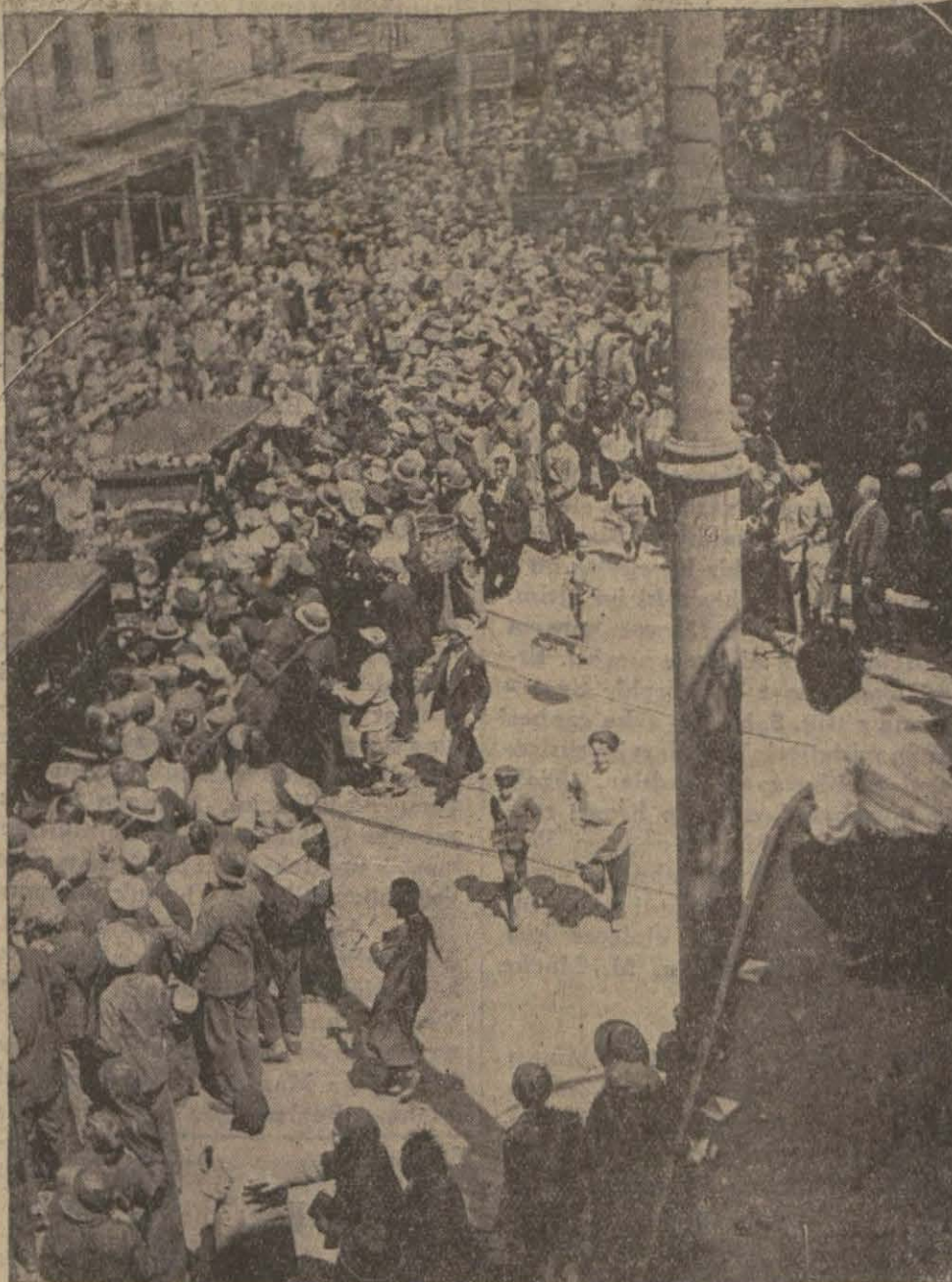
Dün İstanbul'da Dünya Güzeline yapılan muazzam karşılama merasiminde, küçük bir safha ve levha: Sirkeci caddesinde Kraliçenin otomobilini ihata eden halk seli...