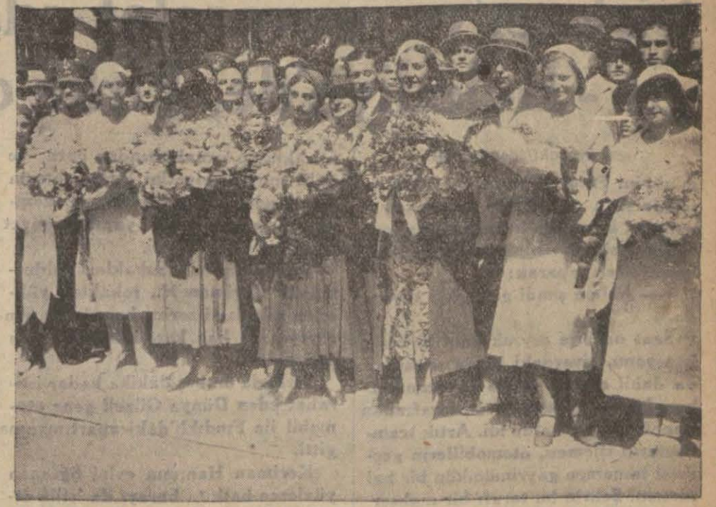
Istasyonda Kraliçeye buket takdim etmek üzere toplanan hanımlar