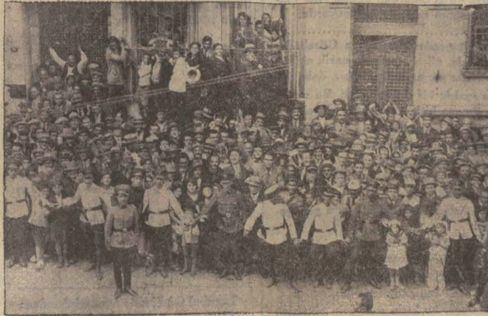
Keriman Hanımın Fırkayı ziyareti esnasında sokağı dolduranlar