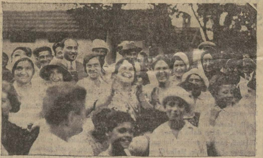
Flores'da çamaşırını bırakıp Dünya Güzeli'ni görmeğe hoşan kadınlar arkadaşları güzelimizi alkışlıyorlar