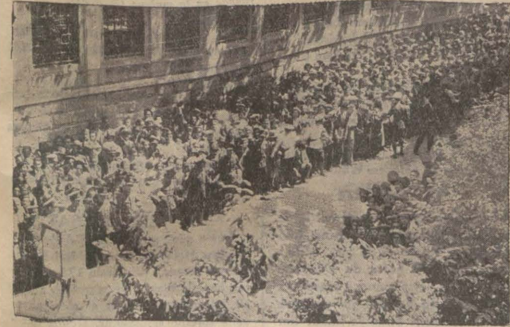
Cumhuriyet matbaası önünde Dünya Güzelinin bekleyenlerden bir kısmı