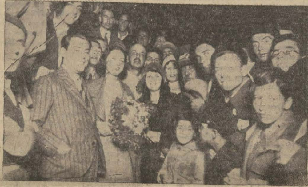
Dünya Güzeli'nin Edirne'de istikbalinden bir görünüşü...