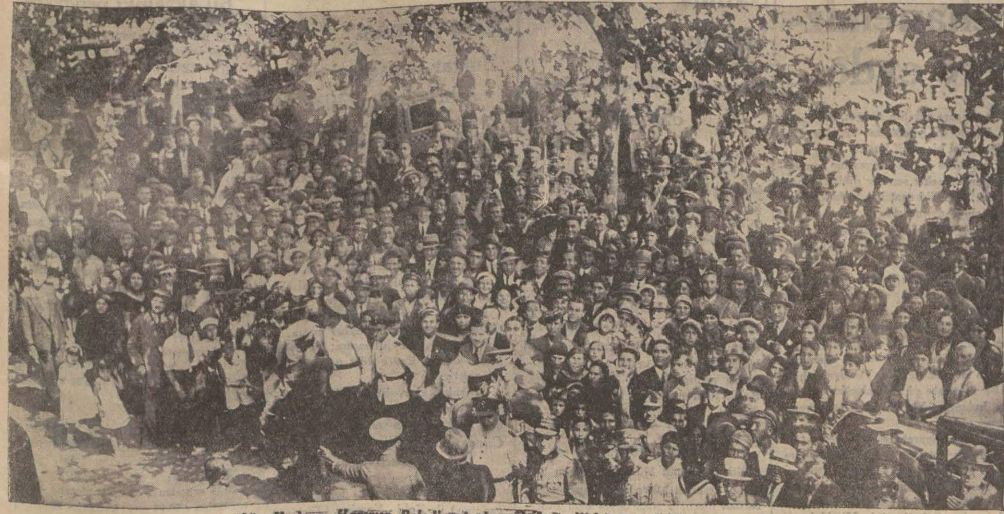
Dün Keriman Hanımın Belediyeyi ziyaretinde kendisini görmek için toplanan halk