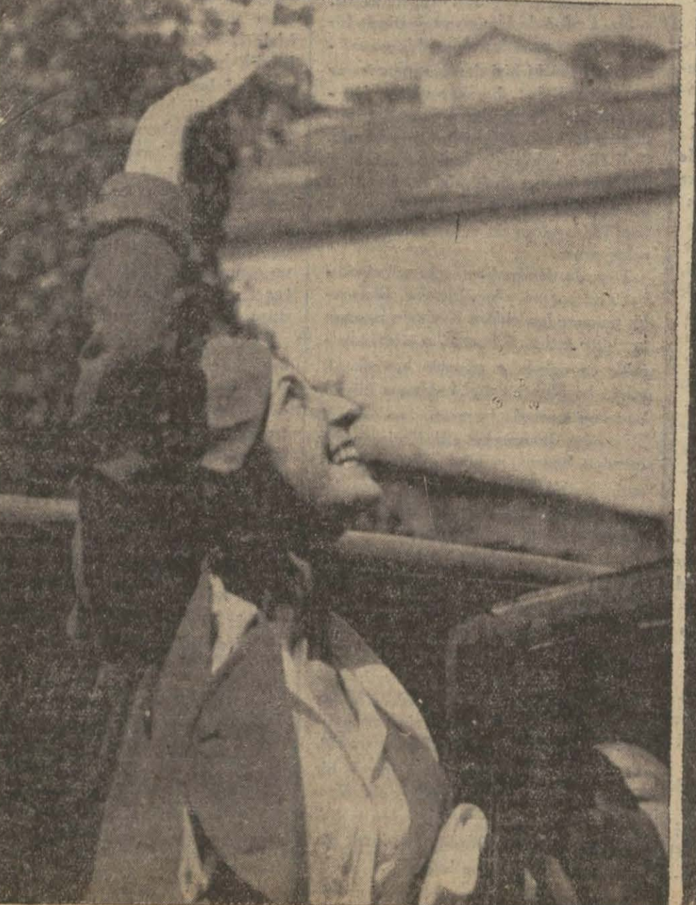
Dünya Güzeli evinin kapısında otomobilden inerken penceredeki ebeveynini selâmlıyor