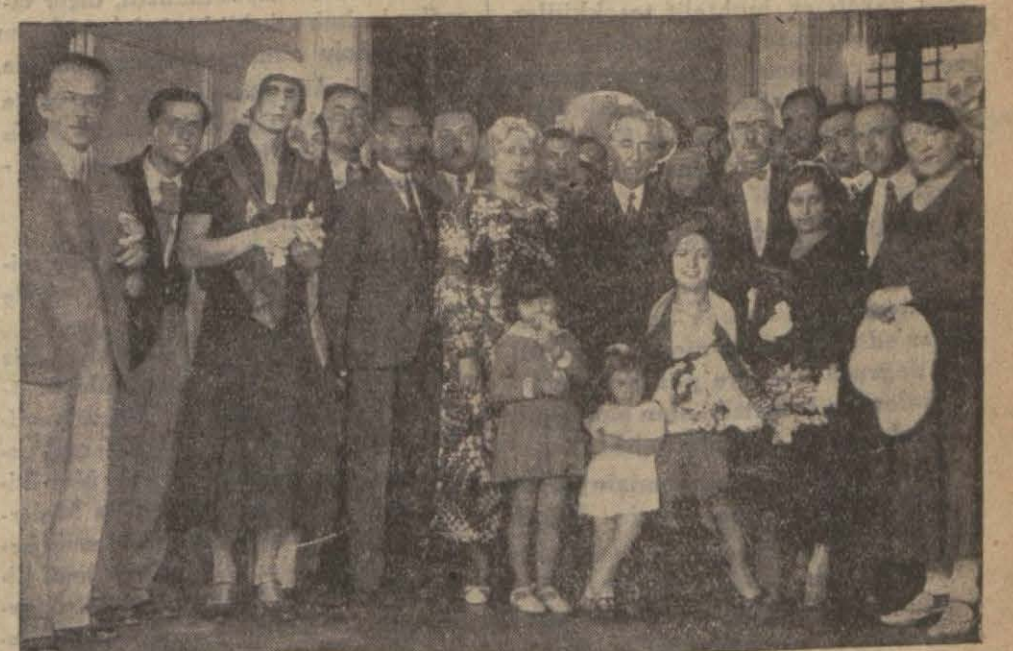
Dünya Güzeli C. H. Fırkası idare heyetile beraber İstanbul Fırka merkezinde