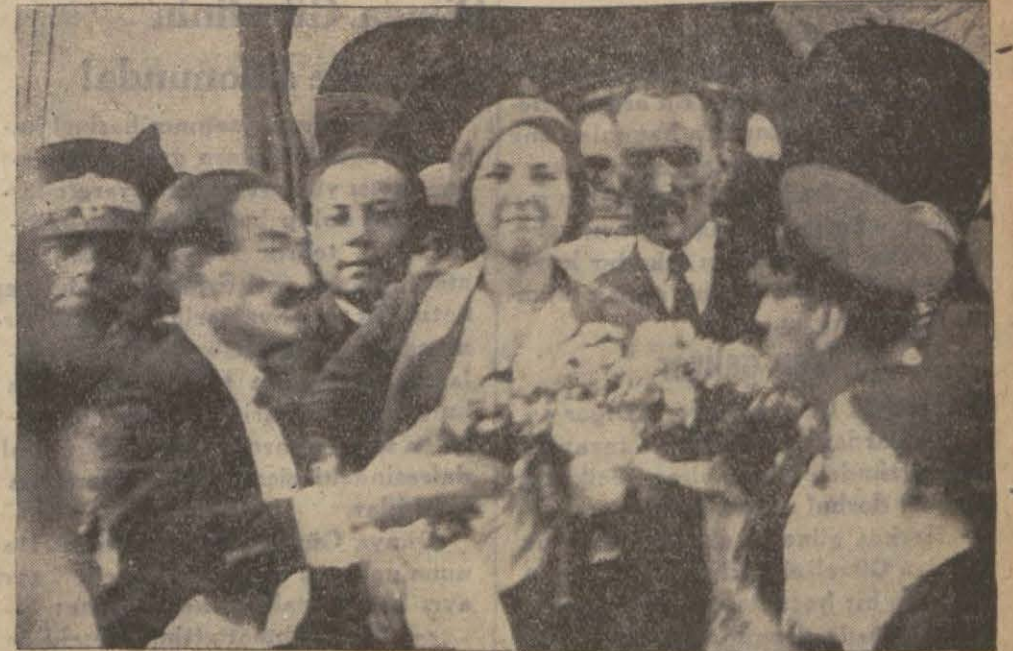
Sirkeci istasyonundan çıkarken Dünya Güzeline buket veriliyor