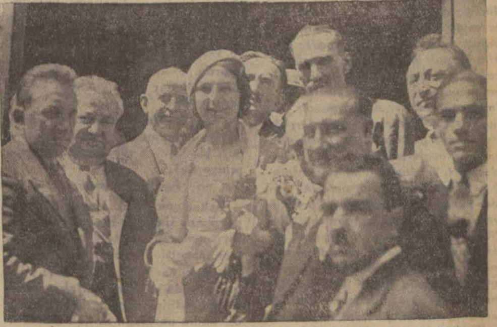
Trenâten çıkar çıkmaz doğru matbaamıza gelen Dünya Güzeli «Cumhuriyet» binası kapısında Başmuharririmiz ve arkadaşlarımızla bir arada

Dünya Kraliçesi olmak manevi cihetten sarfı nazar edilirse hayli üzücü ve külfetli bir iş. Düşünün, iki ay Avrupa'da dolaştım. Bir gün olsun gündüz sokağa çıkmadım. Nereye giderseniz peşiniz sıra muazzam bir kafiye de beraber sürüklüyorsunuz. Böyle gezmek olur mu? Sonra sinema ve fotoğraf almak için kullanılan magnezyum, projektör, elektrik ziyaları gözlerimi az kalsın kör edeceklerdi. 15 gün kan geldi. Doktor, ilaç derdi ile uğraştım. 15 gün cehennem azabı çektim. Hâlâ da ilaç kullanıyorum.