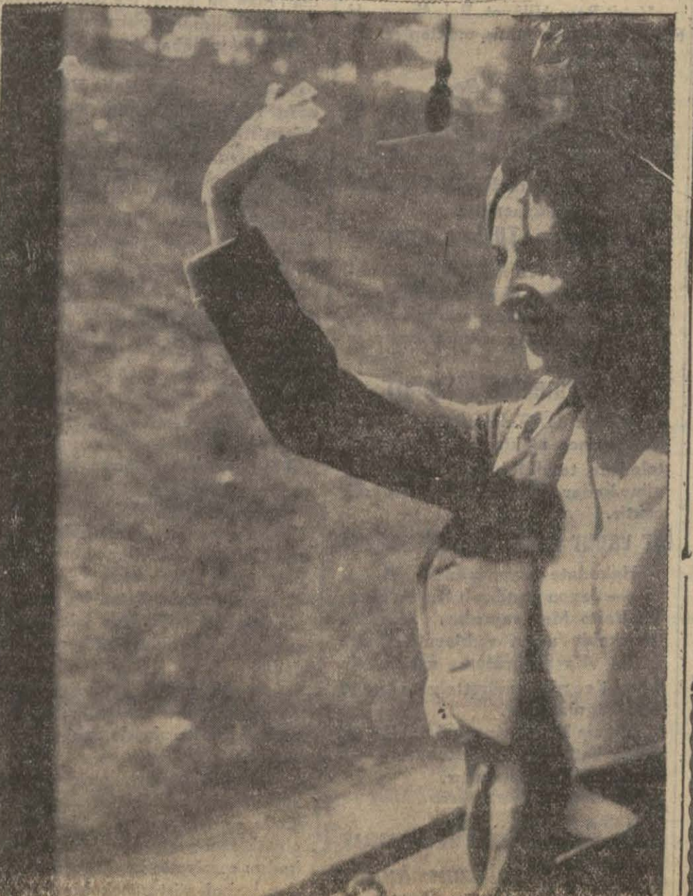
Dünya Güzeli dün İstanbul'a gelinceye kadar bütün hat boyunca halk mütemadi alkışlarına mukabele ediyordu