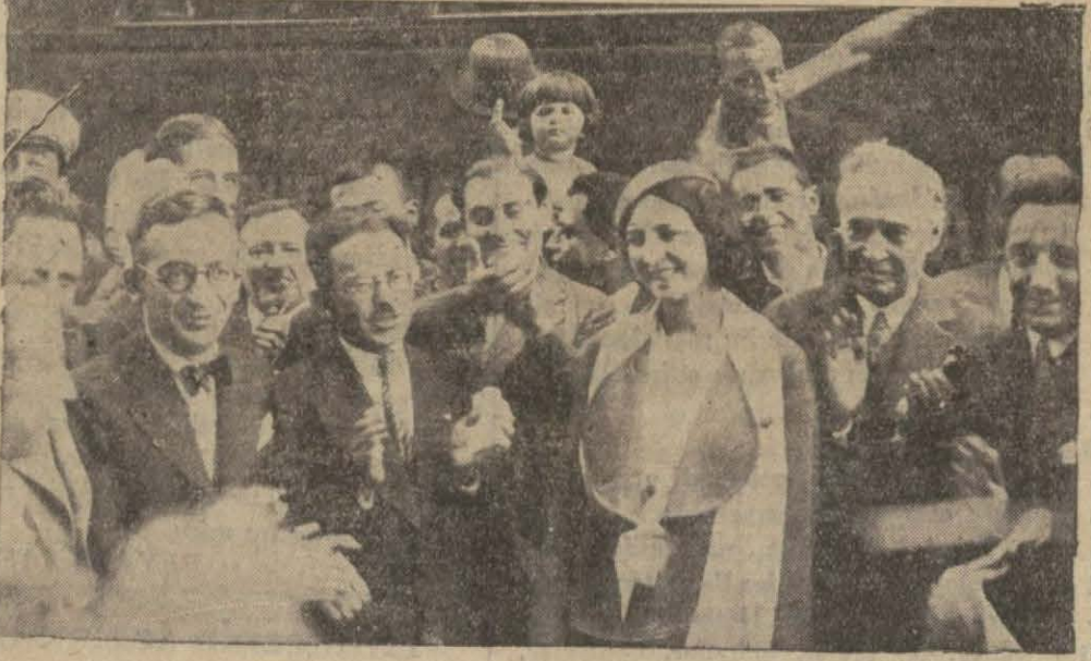
Çekmece'de Kraliçeye tezahürat yapanlar