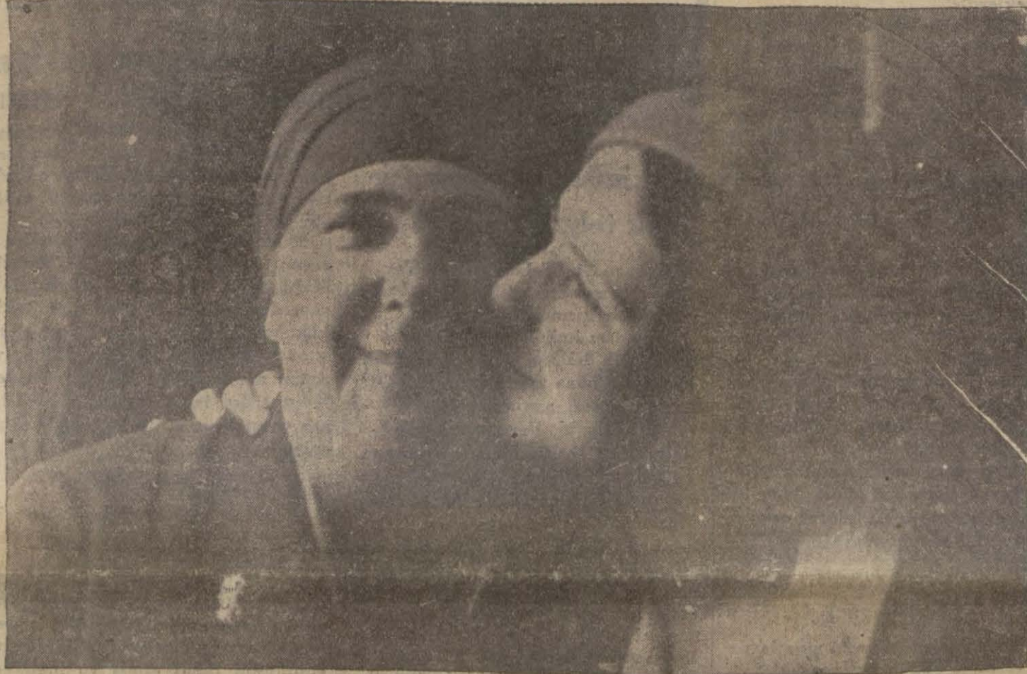
'Annesile Hadimköy'ünde karşılayan Dünya Güzeli ilk hareket huseni esnasında...

Kraliçenin otomobili Sirkeci garından Cumhuriyet'e kadar sel halinde akan halk kütleleri arasında bin müşkülâtla geçti