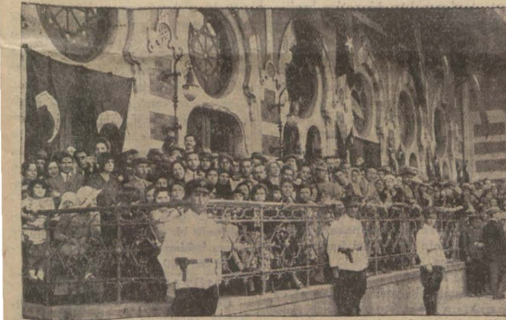
Erin sabah Sirkeci garının haricinde toplanan halktan bazıları...