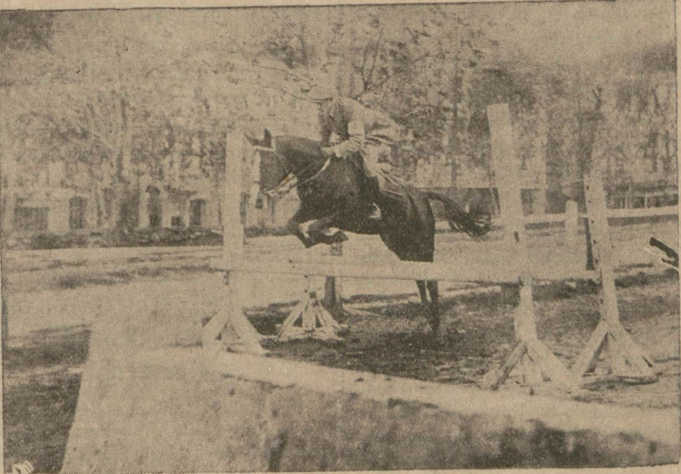
Dün Sipahî Ocağında stivler arasında yapılan müsabakalardan bir itiba

Sipahî Ocağındaki atlı müsabakalar dün daha büyük bir rağbet gördü