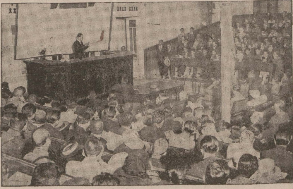
Talebe namına, Hukuk Talebe Cemiyeti kâtibi umumî Fethi B. İradı nüküden

Konferans salonu çok kalabalıktı, tezahürat çok canlı ve heyecanlı oldu