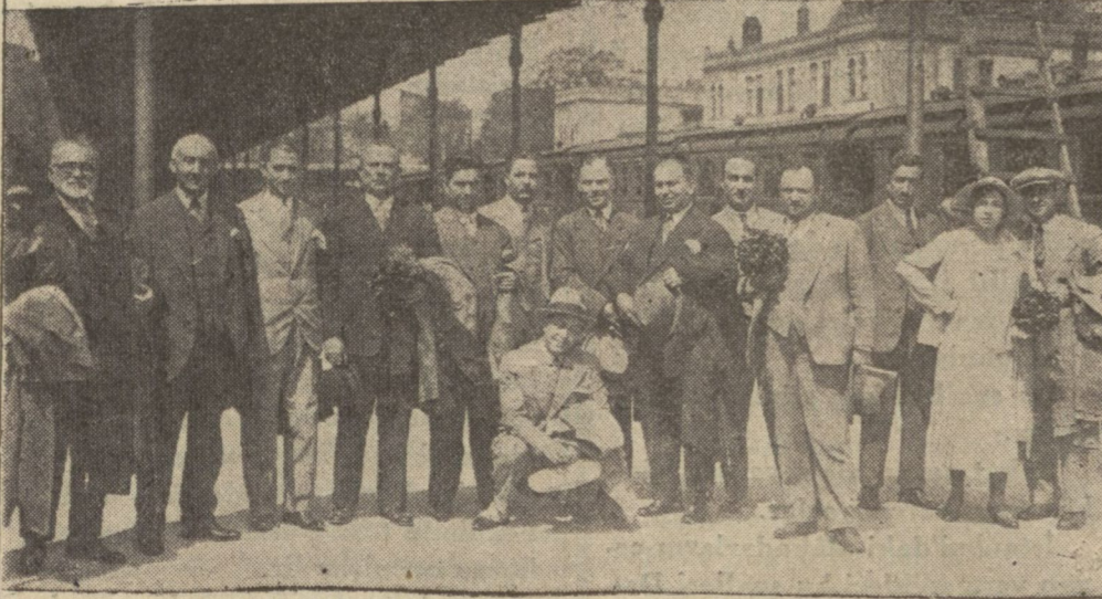
Gazetemizin tertip ettiği Peşte seyahatine iştirak eden ve dün şehrimize avdet edenlerden bir grup Sirkeci istasyonunda

Sergiyi ziyaret edenler dün avdet ettiler