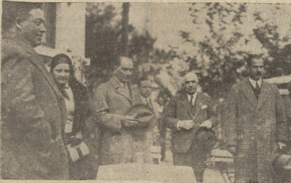
Gazi Hz. evvelki gün çiftliğe gelen davetlileri selâmlarken sini aktedecek ve Reisi Umumi Gazi Hz. bu münasebetle mühim Gazi'nin nutku Yarın sabah kongre son celse.

10 da gene İsmet Paşanın riyasetinde toplanıldı ve nizamname müzakeresi ikmal edildi. Gece celsesi saat yarımaya karar devam etmiş ve nizamname alkışlar arasında kabul olunmuştur.