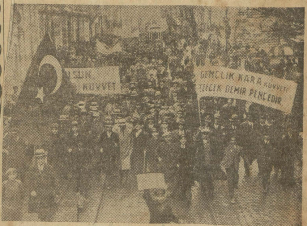
Darülfünun mingine iştirak edenler Taksim'e doğru ilerlerken...

Darülfünun meydanında nutuklar söylendi, Taksim âbidesine çelenkler kondu