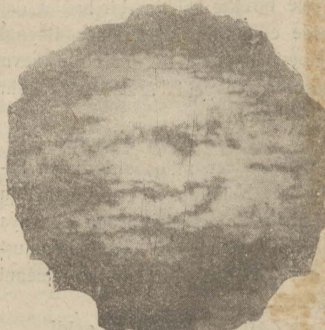
Dün kar toplayan bulutlar

Rasatameden alınan malûmata göre dün tazyik 768 idi. Azami harareti +1, asgarî -3'dür. Dün rüzgâr orta kuvvette olarak şimalden esmiştir. Azami sür'ati saat 17 den sonra saniyede 15 metre-kadardı. Dün sabah 7 den, bu sabah 7 ye kadar yağan karın irtifakı 2 santim-dir. Rüzgâr bu gün şimalden orta kuvvette esecektir. Hava kapalı ve bulutludur. Fasillal kar yağacaktır. İlk ihtimali yoktur.