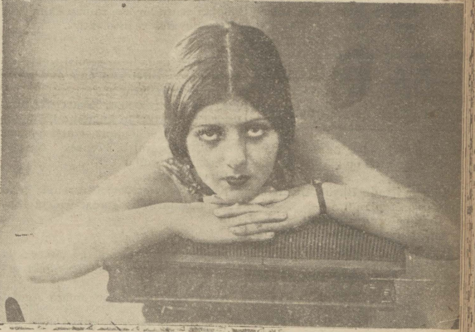
14 — Matmazel "A."

Güzeller, müsabakamıza iştirak etmekle aynı zamanda millî bir vazife ifa ediyorsunuz