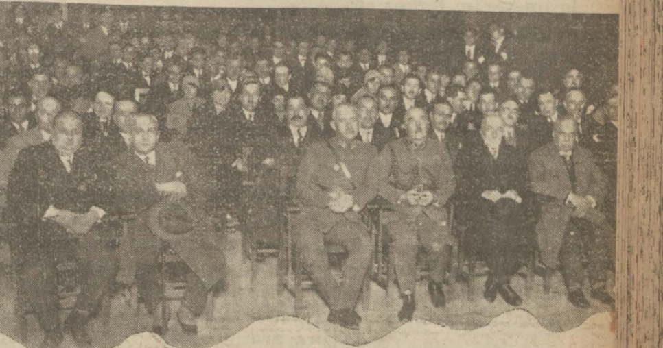
Dünkü müsamerede bulunanlar

Mülkiye mektebinin 53 üncü yıl dönümünü tes'iden, dün saat 16 buçukta, Galatasaray lisesinin konferans salonunda bir içtima tertip edilmiştir.