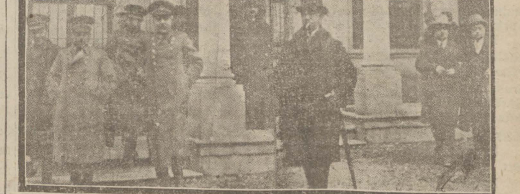
Doktorlar dünkü içtimadan çıkarken