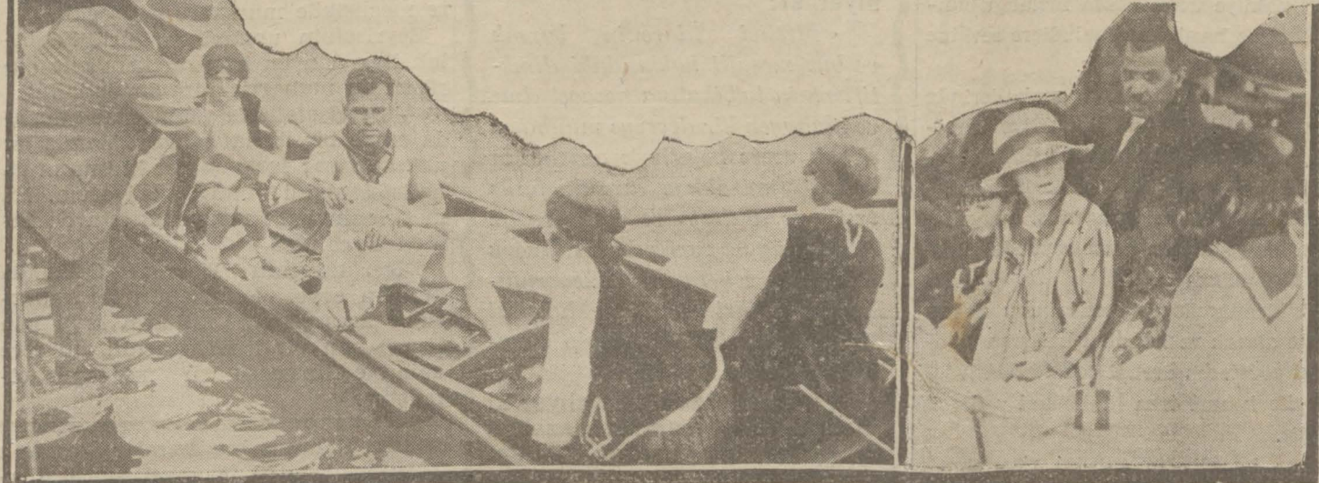
Dünkü yarışlarda lisansların muayenesi ve kâzım Pş. Hz.