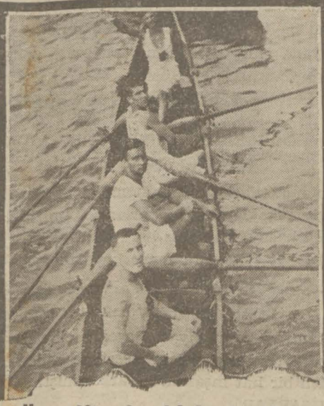
Üç çifte de birinci gelen Beykoz futarı

Bu müsabakalardan sonra yapılan 100 ve 800 yarda yüzme yarışlarında, ve 4X50 bayrak yarışlarını Galatasaraylılar kazanmıştır.