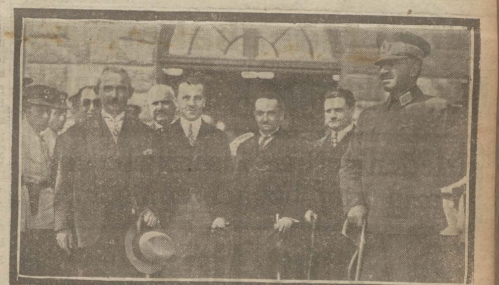
İsmet Pş. Hz. nin Ankaraya muvasalatları

Hariciye Vekilimiz de bu esnada hazır bulunduğundan Yunan mesailinin mevzu bahis edildiği kuvvetle tahmin edilmektedir