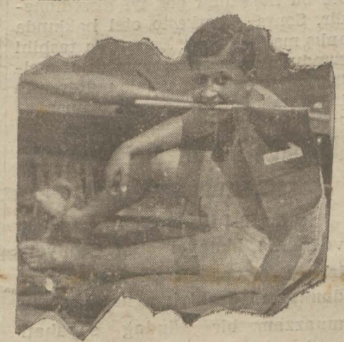
Tek çiftlerin kahramanı

Müsabakaların heyeti umumiyesinde Galatasaray 57 puanla birinci, Beykoz 47 puanla ikinci gelmiş, Ortaköy 3 puan almış, Altınordu, Fenerbahçe, Beylerbeyi, Üsküdar kulüpleri de yarışlara iştirak etmişlerdir.