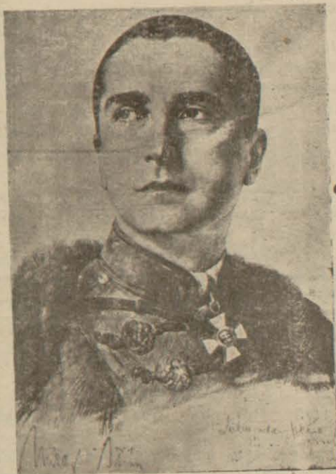
Son Altesse Sérénissime le Vice-Régent de Hongrie, Etienne De Horthy, fils du Régent

parlent de plus en plus d'un remaniement prochain. La modification n'amènerait aucun changement dans la politique extérieure. Elle aurait seulement pour but de donner un nouvel élan à l'équipe ministérielle. Le remaniement se ferait dans le cadre de la répartition des forces parlementaires, où une majorité écrasante appartient au parti gouvernemental.