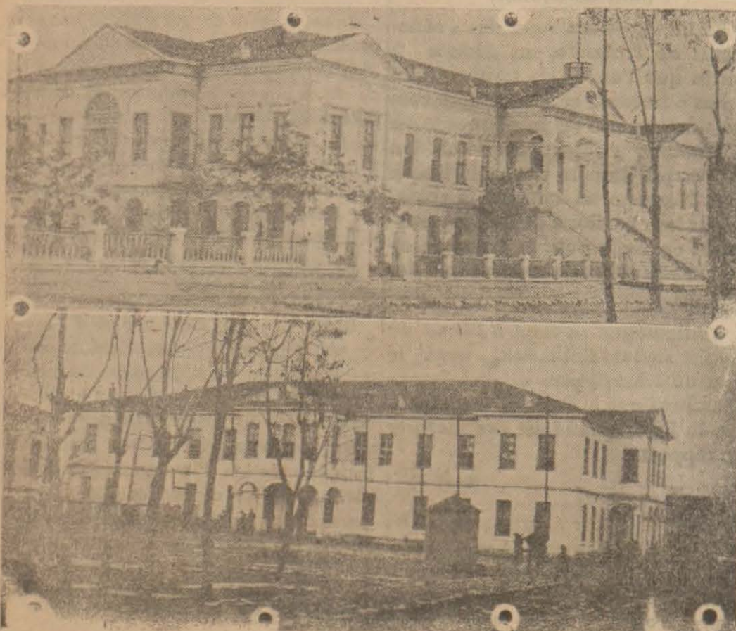
Deux des immeubles détruits par le tremblement de terre à Erzincan : L'inspection de l'armée et le local du gouvernement.