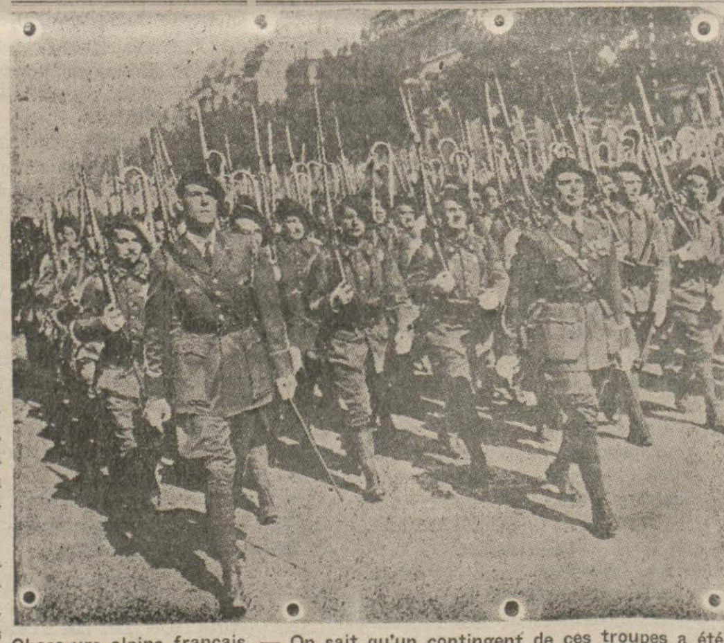
Chasseurs alpins français. — On sait qu'un contingent de ces troupes a été débarqué en Norvège.

Le sous-secrétaire de la propagande du Reich déclarait récemment que l'Angleterre ne saurait jamais admettre la supériorité aéronautique de l'Allemagne. « En effet, note le « Popolo d'Italia », on répète souvent à Londres qu'à la fin de la guerre, les Franco-Britanniques auront une flotte aérienne si nombreuse qu'elle obscurcira le soleil. Mais entretemps, les agents franco-britanniques travaillent aux Etats-Unis en vue de recruter des pilotes et cette activité illégale, qui pourrait mettre en danger la neutralité américaine, a même soulevé la protestation d'un député. Pour un pays ayant un bilan démographique passif, comme la France, ou pour un pays souffrant gravement de la dénatalité, comme l'Angleterre, le problème n'est pas, en effet, de construire un nombre formidable d'appareils, mais d'avoir autant de pilotes et d'équipages qu'il en faut pour les monter. Une flotte aérienne, en effet, se mesure en vol et non à terre. »