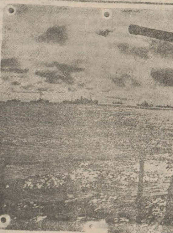
Un convoi en navigation ; vue prise à bord du navire de guerre convoyeur

M. M. Zekeriyâ Sertel résume comme suit les résultats de la guerre en Norvège : L'attaque brusquée que l'Allemagne envisageait de déclencher contre les Balkans ou contre la Hollande est arrêtée.