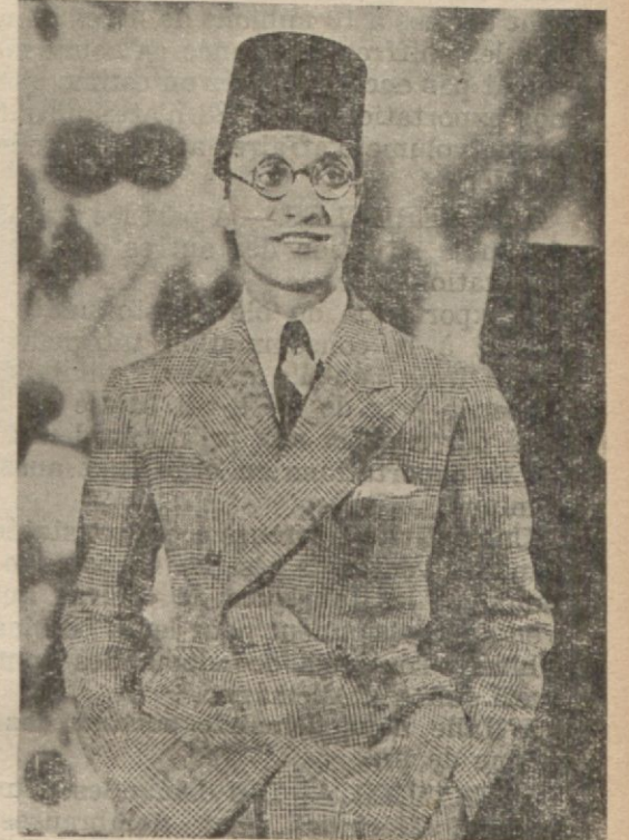
Abdül Vehap, est un des meilleurs chanteurs égyptiens. On le verra sous peu dans « Vive l'Amour ! »

Il a ensuite illustré l'activité du Centre d'Etudes sur la race, dépendant du G. U. F. (Groupe Universitaire Fasciste) d'Addis Abeba, et ses directives sur le prestige de la race suivant les récentes décisions du Grand Conseil du Fascisme.