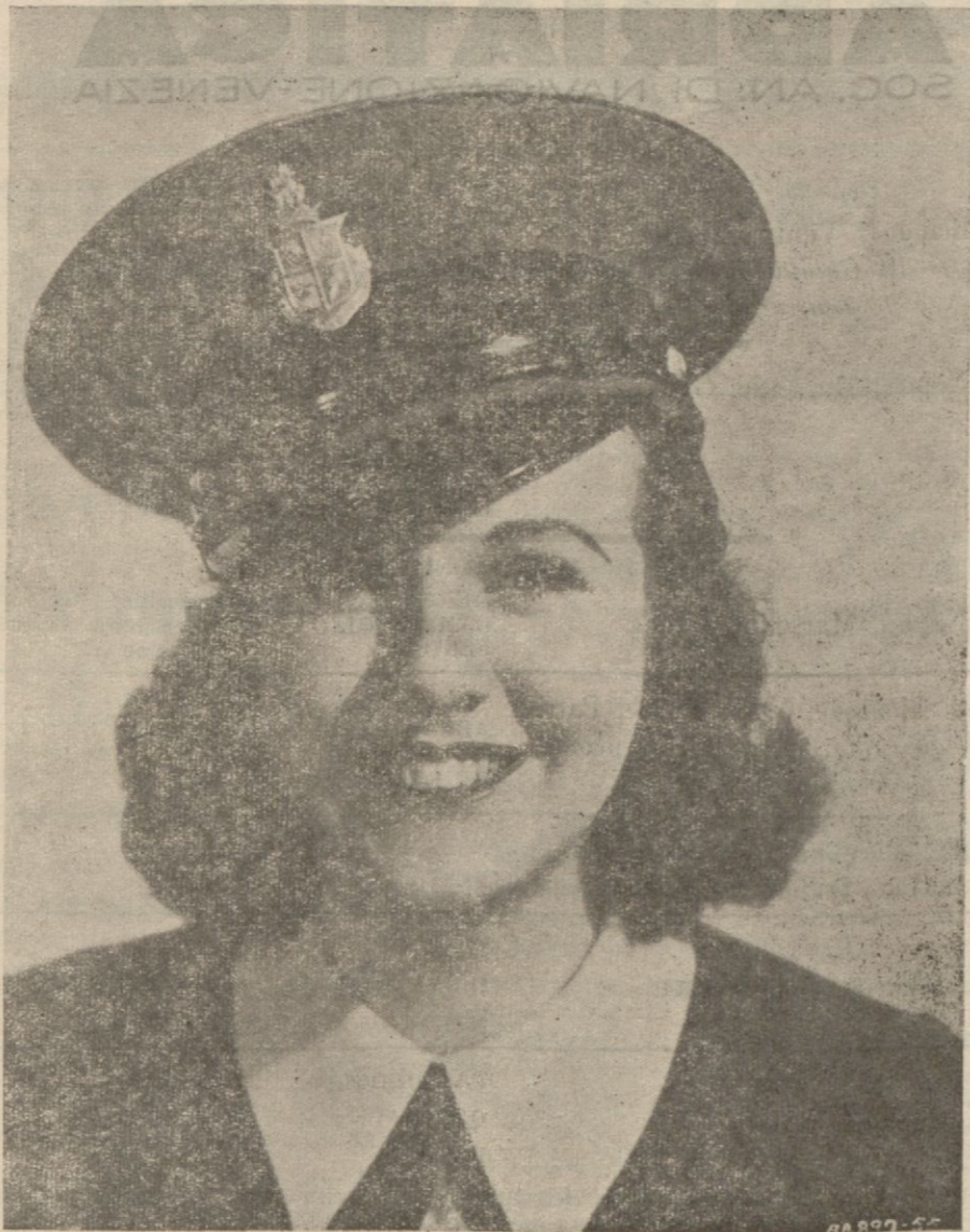
La délicieuse Deanna Durbin, coiffée de la casquette de son premier flirt... à l'écran, le petit collégien du film à succès « Délicieuse ».

Rien ne manque à ce film pour nous réjouir; le mouvement est excellent, les acteurs, Constance Bennett, Alan Mowbray, en serviteur indigné, Billie Burke et Brian Aherne, jouent cette farce comme une comédie, et c'est la force de leur conviction qui fait la faiblesse de notre résistance.