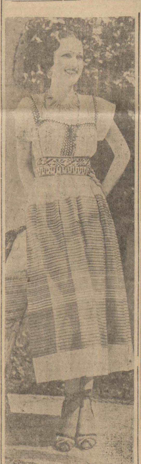
Une gracieuse toilette de Dorothy Lamour

Nous prions nos correspondants éventuels de n'écrire que sur un seul côté de la feuille.