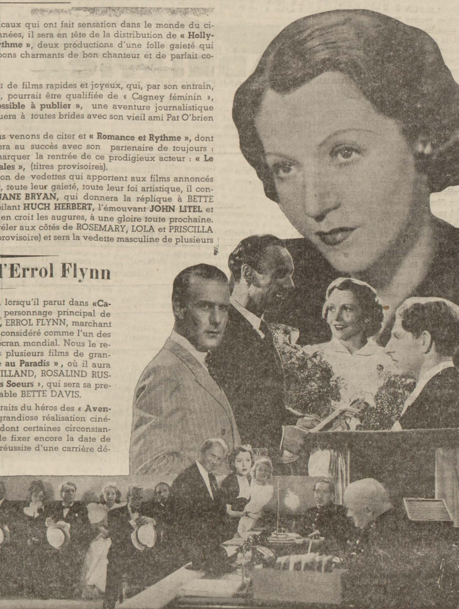
Quelques scènes de l'amusante comédie : « Ma femme s'amuse ». La protagoniste de ce film est Kate de Nagy et le régisseur Vorcheven.