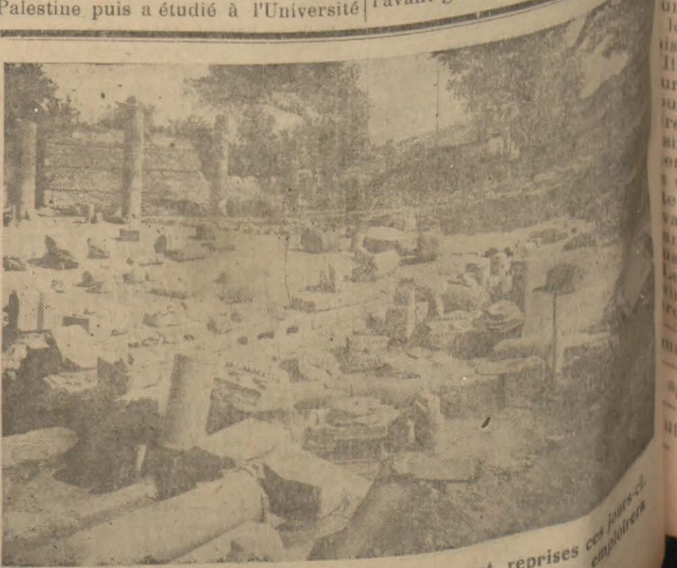
L'ancienne agora d'Izmir où les fouilles seront reprises ce printemps. Avec l'autorisation du ministère de la Justice, on y a réintégré trente détenus de droit commun.

Rome, 6. — Le ministère de la Santé et de la propagande fasciste a fait publier une brochure illustrée écrite en plusieurs langues sur les résultats obtenus par la campagne anti-tuberculeuse. Cette publication qui est en tout particulièrement axée sur les dangers de la tuberculose, a été diffusée dans une commission internationale attachée au B. I. T.