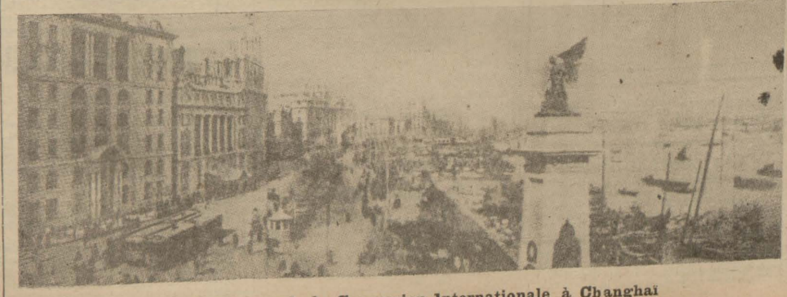
Une des avenues de la Concession Internationale à Shanghai