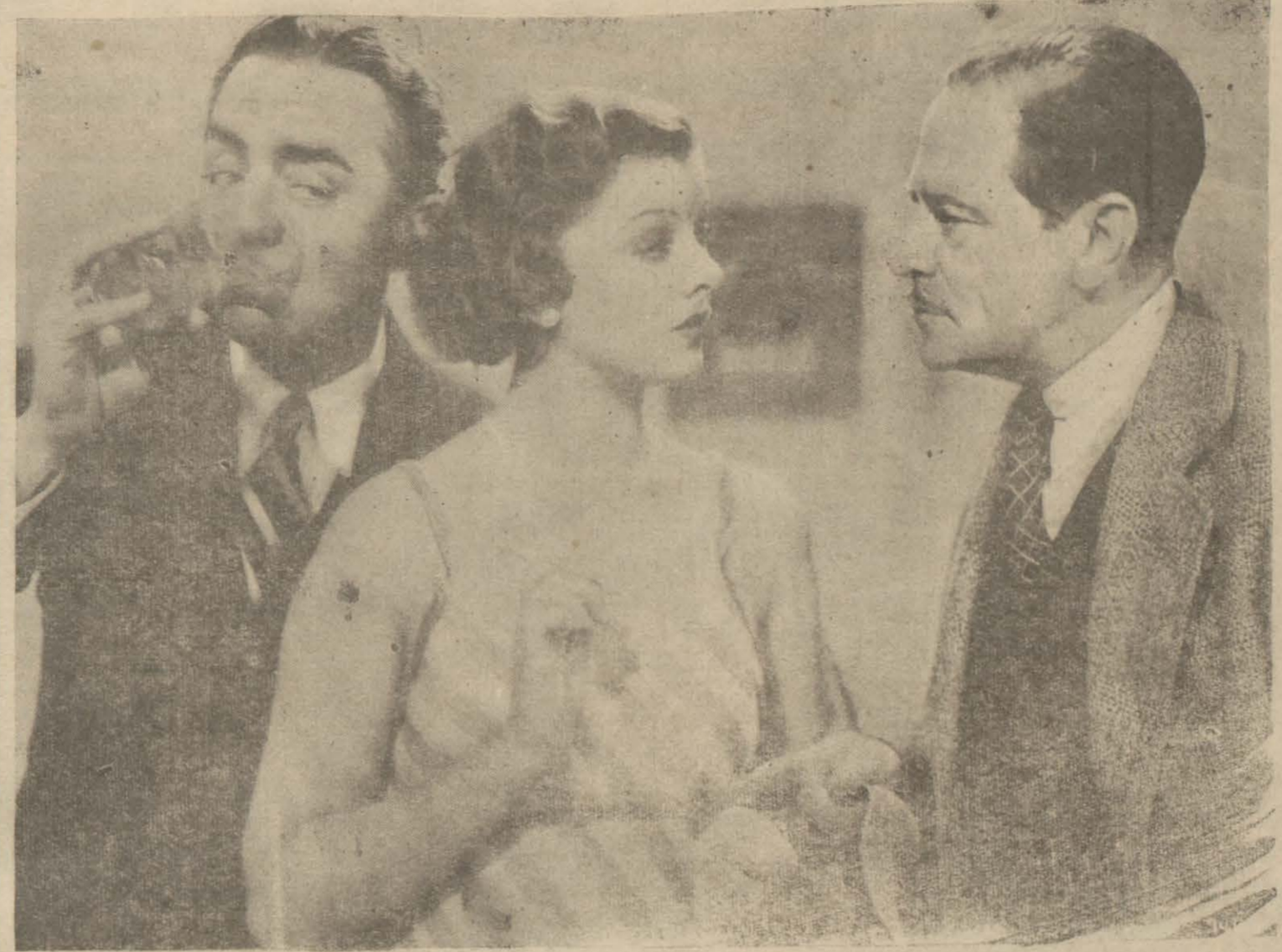
Myrna Loy et William Powell dans un de leurs derniers films