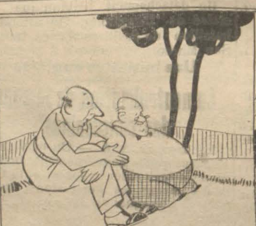
— J'aime bien les îles... Mais as-tu remarqué,

Pour tous renseignements et pour retenir sa place, s'adresser au Secrétariat de l'Union Française.