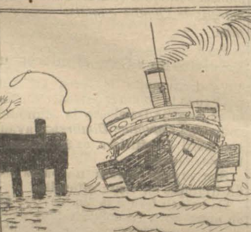
...dès qu'arrive un bateau d'Istanbul...

(Dessin de Cemal Nadir Güler à l'Alkam) 3