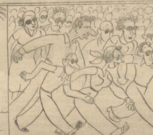
... la façon dont les insulaires se précipitent au débarcadère...