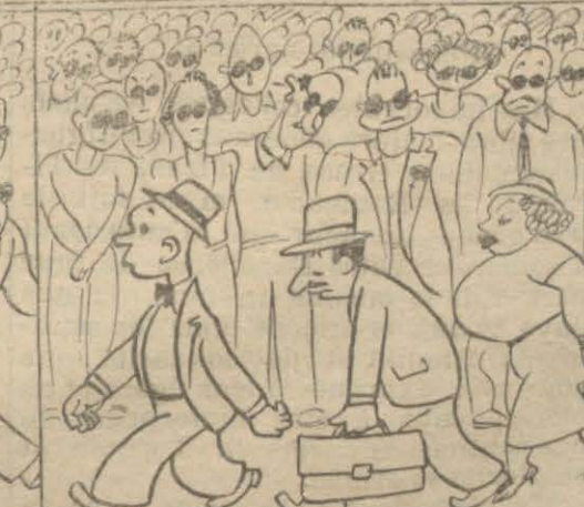
... pour voir défiler les nouveaux arrivants ? Pourquoi cette affluence ?