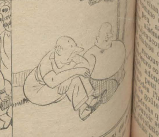
— Pour admirer les nouveaux arrivants ?

perdre 3 heures par jour dans un bateau à roues !