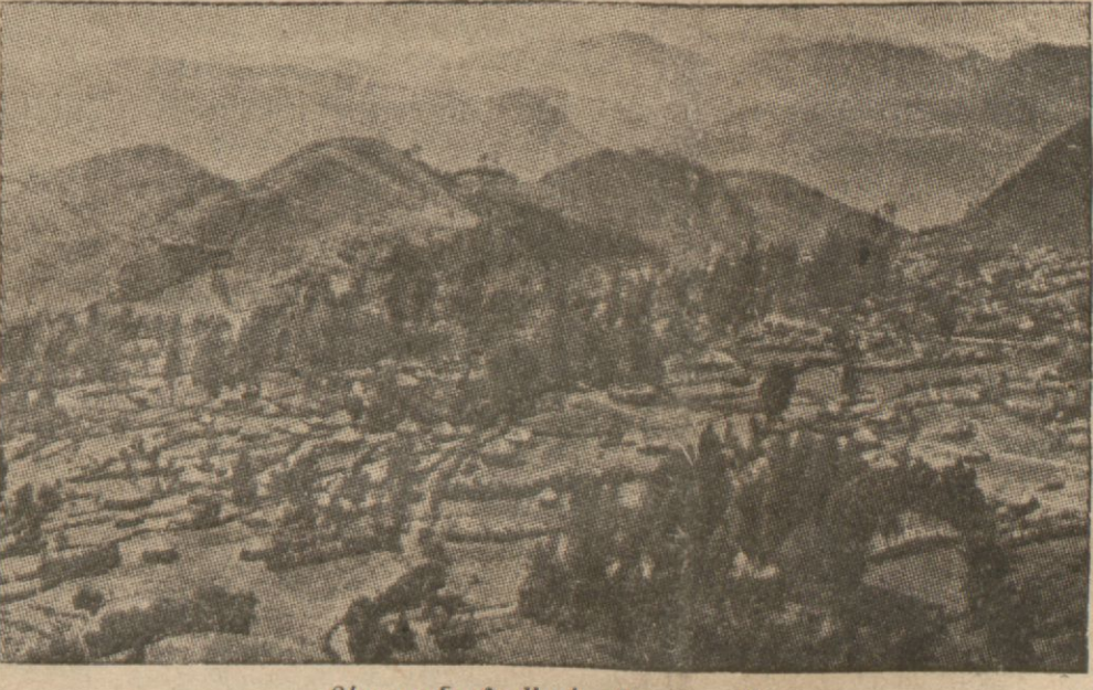
Տեսարան մը Ատիս Ապապային