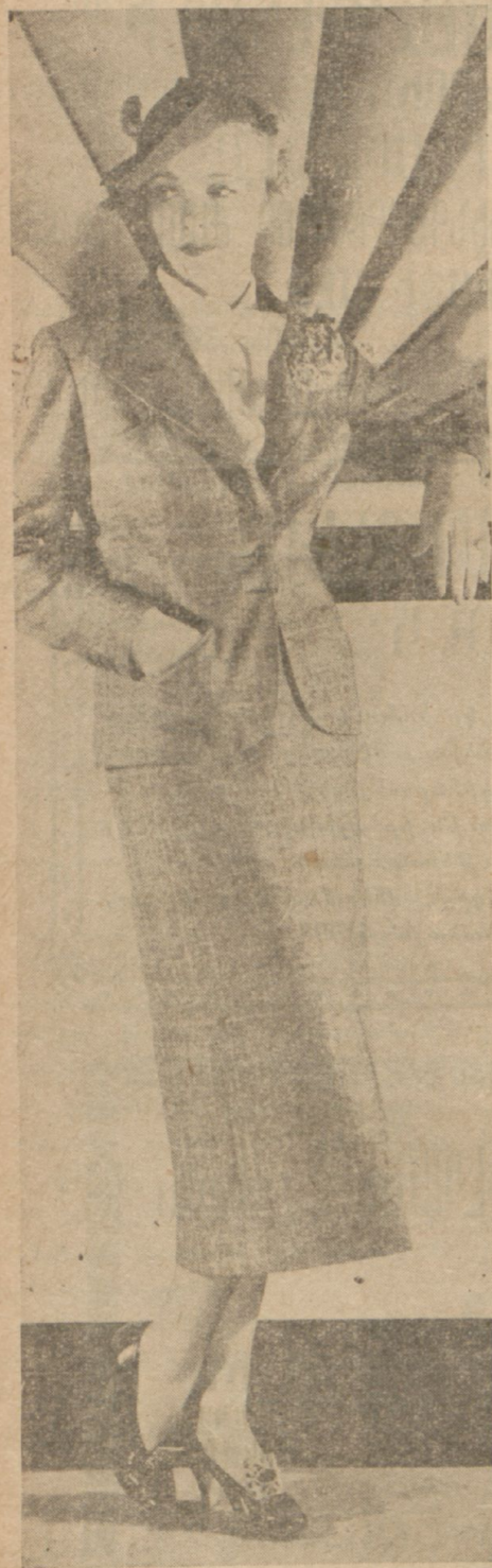
Գարնանային երկու շքեղանային