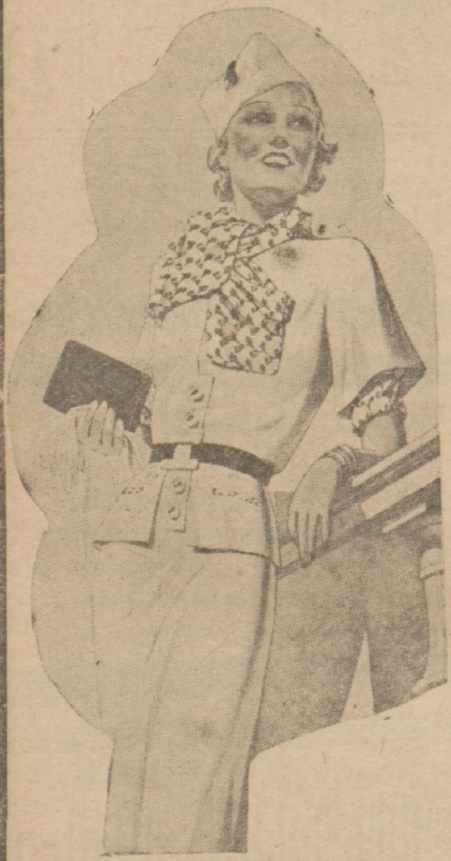
Ամառնային զգեստ վերջին նորածնութեամբ

Կ Ի Ն Ե Ր 2եր ամառնային տրագգեստներու համար Ֆանթեզի եւ կոմպլեքս կերպանակներ ՄՈՒՍԼԻՆԷՅԻ, զանազան Վր. քստեցներով, մերթ 50 եւ 38 ՔՐԱՎԵՐՍԻՆԱ, գիւղական մերթ 50 ԳՐԷԲ ԺԱՔՈՆԷՉ (ֆիմոնյի համար), մերթ 50 ԿՐԱՆԻՅԻ ՖԱՆԹԷՉԻ, բիծամայի եւ բենուարիքի համար, մերթ 48 ԲԻՔԷ ՖԱՆԹԷՉԻ զոգց գզեստներու համար, մերթ 60 ՄԱՐՕՔԷՆ ՖԱՆԹԷՉԻ, » 85 ՕՐԿԱՆԹԻՆ ՖԱՆԹԷՉԻ, լաւ սեսակէ, մերթ 135 եւ 100 ԹՅՊՐԱՒԻՔՕ, անցիական ապրանք, մերթ 75 ՄԻԼԷՆ, միագոյն եւ Ֆանթեզի, մերթ 140 եւ 110 ՏՈՒՊԻ ԺՕՐԺԷՅԻ, միագոյն եւ Ֆանթեզի, մերթ 125 եւ 110 ՔՐԷԲ ՈՒՔՕ, վերջին նորայր երկու կողմը միտքիակ, մերթ 140 ԹՈՒՍԱԼ ԲԱՆԱՄԱ, փայլուն-բոյրեղի համար, 140 անցիական լայնով, մերթ 270