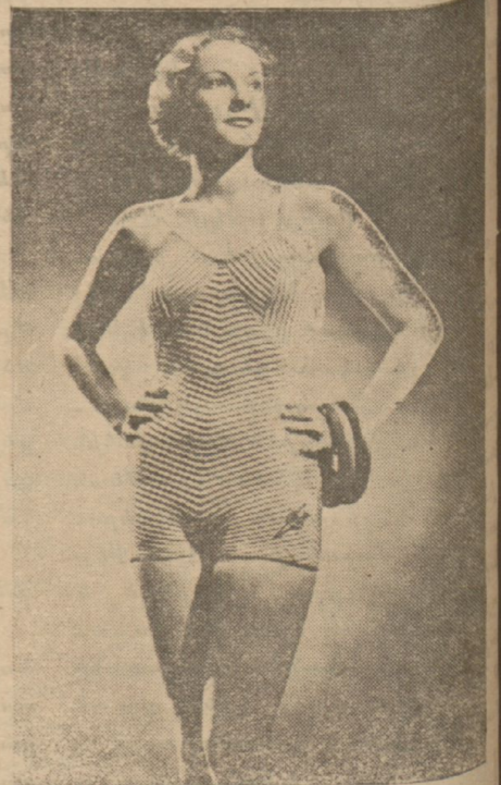
ԾՈՎԱՅԻՆ ԼՈՂԱՆՔԻ ԶԳԵՍՏՆԵՐՈՒ ԱՄԵՆԷՆ ՎԵՐՋԻՆ ՋԻԵՐՈՒ ՈՒ ԵՒՐՈՒԱՅԻ ԱՄԵՆԷՆ ՀՈՉԱԿԱՒՈՐ ՄԱՐՔԱՆԵՐՈՒ

Ծովային լողանքի առարկաներ ձոխ սեսակներ ԿԻՆԵՐՈՒ ԵՒ ՍՅԵՐՈՒ ՅԱՏՈՒԿ ԾՈՎԱՅԻՆ ԲՕՍԹԻԻՄՆԵՐՈՒ Շաս գեղեցիկ սեսակներ ԵԱՆՍԷՆ, ՔՕՐՄԱ ԵՒ ԿՕԼՏԷՇ մաշկաներու ամենէն լաւ սեսակները Ծովային գլխարկեր հարխներէ աւելի մոտէ-ներով, 40 դր.էն սկսեալ Ծովու կօշիկներ եւ սանդալներ 135 դրուէն սկսեալ ՊՈՒՐՆՈՒՄՆԵՐ ԲԻԺԱՄԱՆԵՐ, ԲԼՍԺԻ ԽԱՂԱՒԿՆԵՐ ԵՒ ԳԼԽԱՐԿՆԵՐ