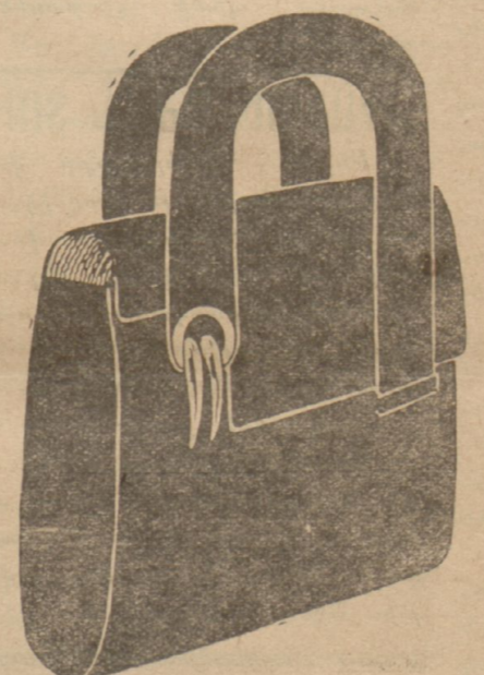
ԶԵՆՆԱՊԱՅՈՒՍԱԿՆԵՐ ՍԱՖԻԱՆ ՄՐՈՒՇԷ ՆՈՐԱԶԵՒ ԳՈՅՆԵՐՈՎ 625 ՂՐԱՇ

ԶԵՆՆԱՊԱՅՈՒՍԱԿՆԵՐՈՒ ԸՆՏԻՐ ՏԵՍԱԿՆԵՐ Ամէն գոյնէ եւ անմրցելի գիներով Ղրու: Զեռնապայուսակներ, կաշիէ, ճերմակ գոյն եւ կոթով 350 Զեռնապայուսակներ, Սաֆիան մարթ 625 Զեռնապայուսակներ, Իսկական օձի մարթով եւ կոթով 850 Սրբի ձեռնապայուսակներ 425 ՍՅԵՐՈՒ ԵՒ ՍՅԱԿՆԵՐ ԲՕՐԻՆ ԵԱՊԻԿՆԵՐ ԳՁԱՌՈՐ, ԵԱՍ ՔԵՐԻՆ ՄՐՈՒ ԵԱՊԻԿՆԵՐ ԲՕՐԻՃԷՆ ԵԱՊԻԿՆԵՐ, միագոյն, ժեր-սիէ, կէս բեւերով 300 ԽԱԿՈՏԿԷՆ ԵԱՊԻԿՆԵՐ 200 ԲՕՐԻՃԷՆ ԲԻԺԱՄԱՆԵՐ, միագոյն 340 ԳՄԱՒՈՐ ԲԻԺԱՄԱՆԵՐ, բօր-լիճէ, Ֆանթեզի եւ խիստ լաւ սեսակէ 375