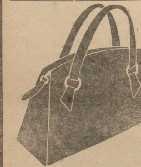
ՄՐՈՒ ԶԵՆՆԱՊԱՅՈՒՍԱԿՆԵՐ ՎԵՐՋԻՆ ՆՈՐՈՅԹ ԶԱՆԱԶԱՆ ԳՈՅՆԵՐՈՎ 425 ՂՐՈՒՇ

ԶԵՆՆԱՊԱՅՈՒՍԱԿՆԵՐՈՒ ԸՆՏԻՐ ՏԵՍԱԿՆԵՐ Ամէն գոյնէ եւ անմրցելի գիներով Ղրու: Զեռնապայուսակներ, կաշիէ, ճերմակ գոյն եւ կոթով 350 Զեռնապայուսակներ, Սաֆիան մարթ 625 Զեռնապայուսակներ, Իսկական օձի մարթով եւ կոթով 850 Սրբի ձեռնապայուսակներ 425 ՍՅԵՐՈՒ ԵՒ ՍՅԱԿՆԵՐ ԲՕՐԻՆ ԵԱՊԻԿՆԵՐ ԳՁԱՌՈՐ, ԵԱՍ ՔԵՐԻՆ ՄՐՈՒ ԵԱՊԻԿՆԵՐ ԲՕՐԻՃԷՆ ԵԱՊԻԿՆԵՐ, միագոյն, ժեր-սիէ, կէս բեւերով 300 ԽԱԿՈՏԿԷՆ ԵԱՊԻԿՆԵՐ 200 ԲՕՐԻՃԷՆ ԲԻԺԱՄԱՆԵՐ, միագոյն 340 ԳՄԱՒՈՐ ԲԻԺԱՄԱՆԵՐ, բօր-լիճէ, Ֆանթեզի եւ խիստ լաւ սեսակէ 375