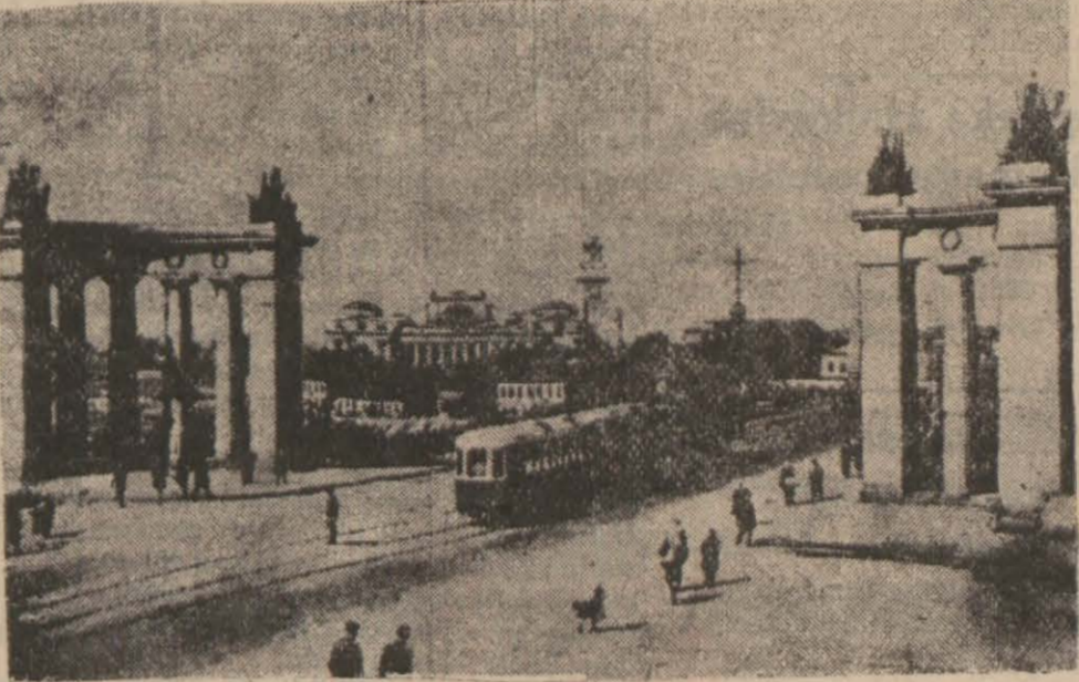
Moskovadan bir görünüş

buğday ve yüzde kırk arpa karıştırılacak, çavdar konmayacaktır. Koordinasyon heyetinin bu kararı yakında tatbik edilecektir.