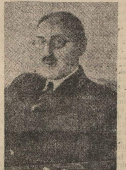
Irak başvekli Raşid Ali Geylânî Beyrut, 29 (Radyo) — Irak teb-