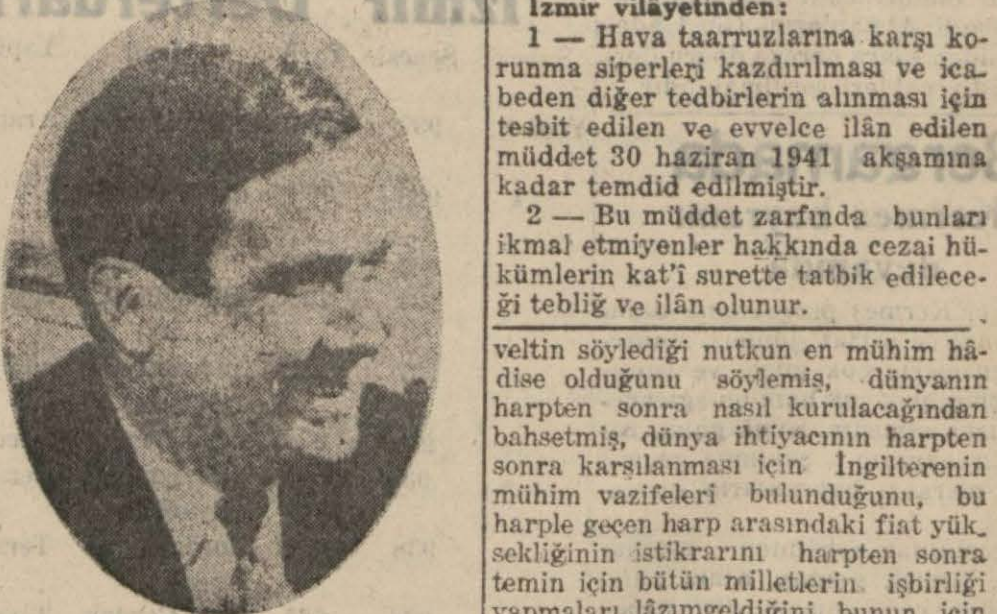
Bay Eden Londra, 29 (Radyo) — Hariciye nazırı Eden, beyanatta bulunarak Ruz-

Almanyanın dünya sulhünü ihlâline meydan verilmeyecek