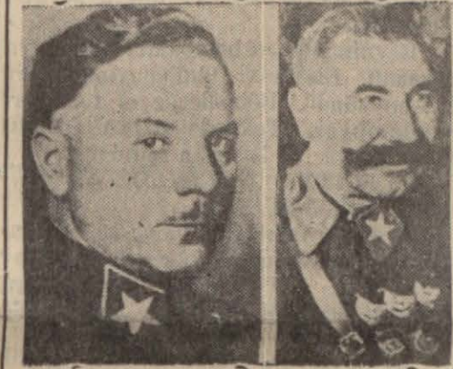
Sovyet mareşallerinden Vorosilov ve Budiyeni Vişi, 8 (A.A.) — Ofi ajansının Sovyet hududundan öğrendiğine göre, —Devamı 4 ncü Sahifede—