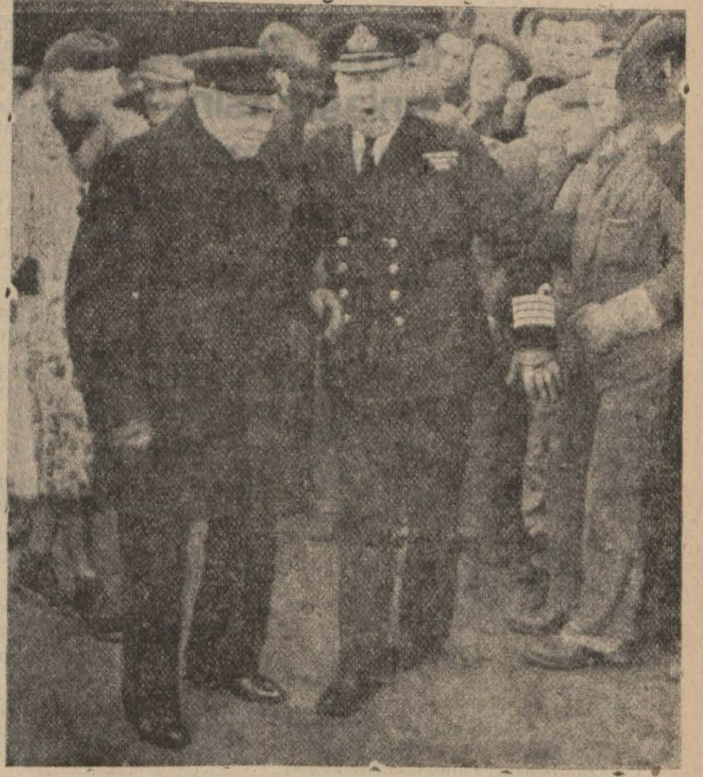
Çörçil İngiliz deniz işçileriyle görüşüyor

İskenderiye üzerinde istikşaf uçuşu yapmağa gelen bir düşman tayarası avcılarımız tarafından düşürülmüştür.