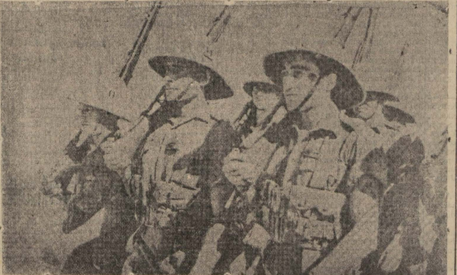
Hür Fransız kitaları yürüyüş halinde