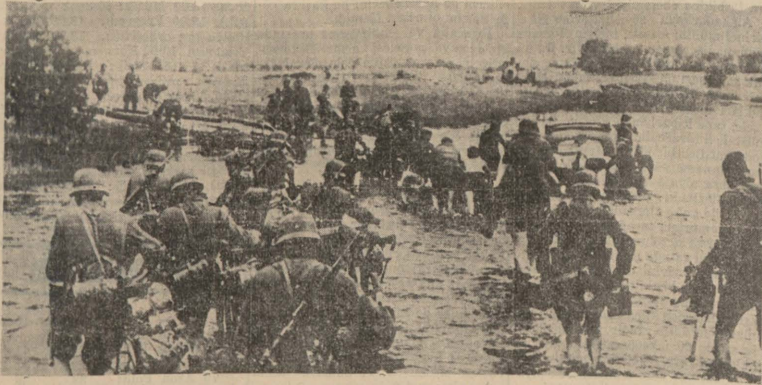
Bir Alman bisikletçi kolu bir nehri geçerken

Her gün sabahları (İzmir) de çıkar siyasî gazetedir.