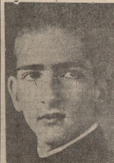
Yugoslavya kralı Piyer

Kahire, 4 (A.A.) — Yugoslavya krallık orduları başkumandanı bura — Devamı 4 üncü sahifede —