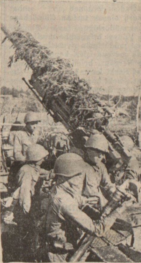
Sovyet topçuları faaliyette

Almanlar Mariyopol hatında tutunabiliyorlar. Libyada sükün var