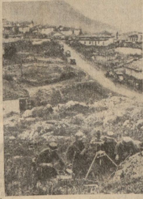
Alman askerleri Şimalî Afrikada keşif faaliyetinde

Londra, 25 (A.A.) — Selâhiyetli makamlara, Almanların yakında İspanyaya hücum edebilecekleri teyid eyler mahiyette hiç bir haber gelmemiştir. Hitlerin Alman başkumandanlığını ele alması üzerine Avrupa'da yeni hareketler beklenmesi lâzım geldiği hakkında son 48 saat zarfın-