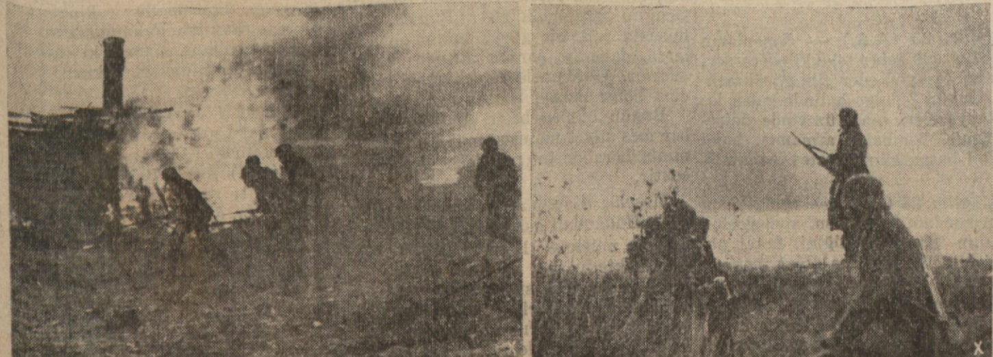
Noelde cephelerde görülen vaziyet işte böyle idi.