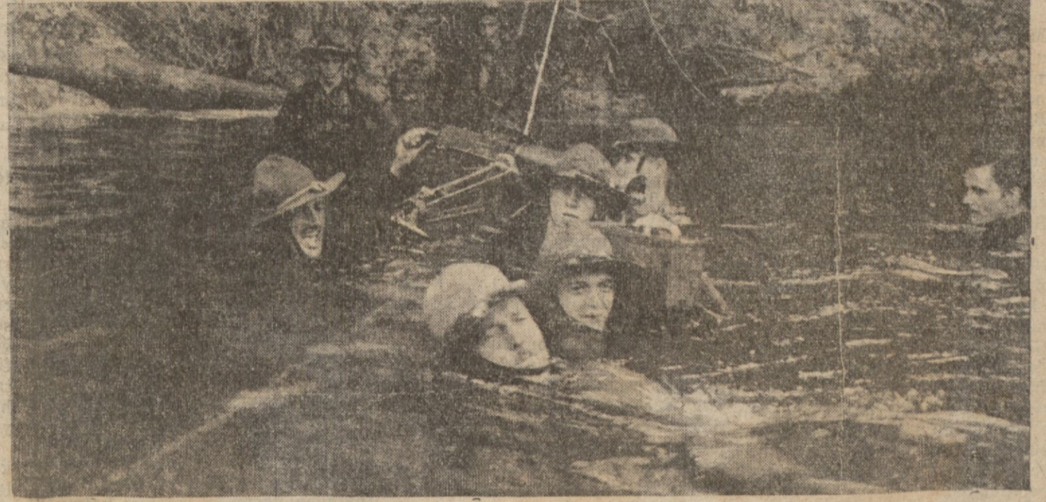
Amerikan kuvvetleri bir nehirden ağırlıklarıyla geçme egzersizleri yaparlarken