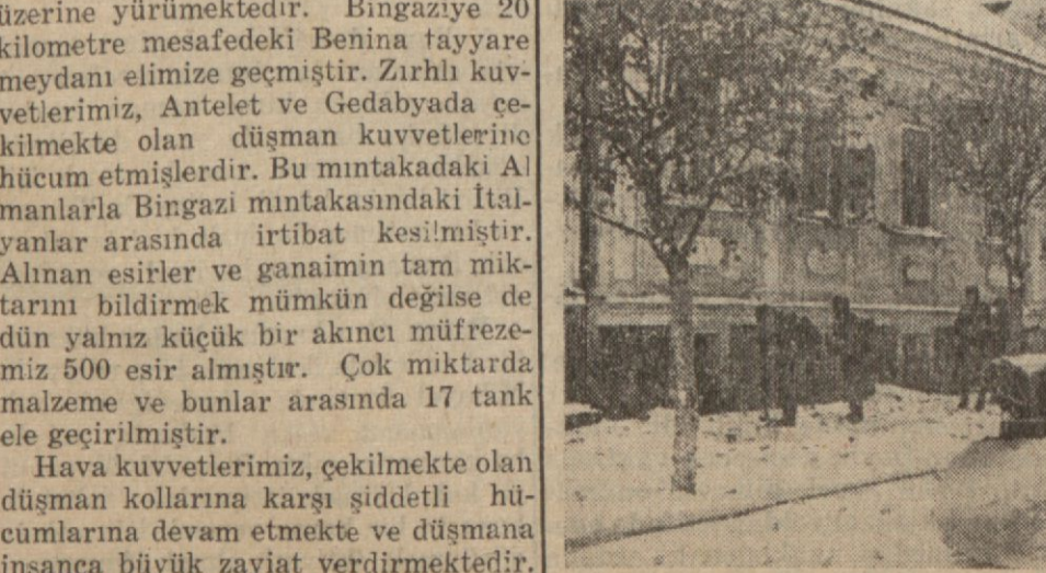
Şark cephesine aid yeni resimler: Şimdi Rusların elinde bulunan Kalinin şehrinin karlı sokaklarında Alman tank ve askerleri, Leningrad cephesinde kar yığınları arasında bir Alman askeri

Şehrimizde son günlerde bazı Difteri vak'aları görülmüştür. Kız lisesinde, son sınıflarda dört vak'a kaydedilmiştir. Başka bir iki mektepte de aynı müşahedeler olmuştur. Mektep gibi talebe topluluğunun fazla mütakâsif bulunduğu ve sirayet imkânlarının fazlalığına mukabil kontrolün daha güç olduğu müesseselerde böyle bir hastalığın çok tehlikeli olduğuna şüphe yoktur. Alâkadarların ehemmiyetle nazarı dikkatini celbederiz: Mevzu daha esaslı şekilde tedkik edilmeli ve mümkünse mektepler tatil edilmelidir. Esasen şurada yılbaşı tatiline pek az zaman kalmıştır. Binaaleyh tatilin herhangi fazla bir mahzuru olamaz.