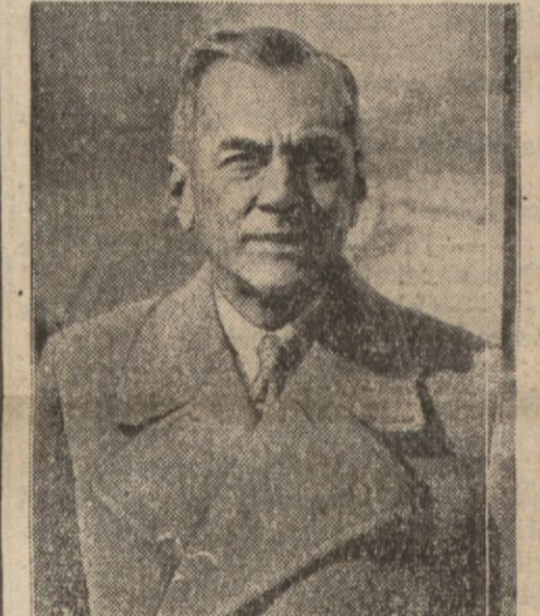
Ordunun kumandasını eline alan Filipin reisicumhuru Kuizon

Moskova, 24 (A.A.) — Dün geceki Sovyet tebliği: 23 ilkkâunda kıtalarımız düşmanla bütün cephelelerde çarpışmaktadırlar. Kıtalarımız batı Kalinin ve cenup batı kesimlerinde şiddetli muharebeler vererek ilerlemişlerdir. Bir çok yerler alınmıştır. Bu arada mühim bir demiryolu kavuşağı olan Gorbasevo ile Şerefov ve Odeyef — — Devamı 2 inci sahifede —