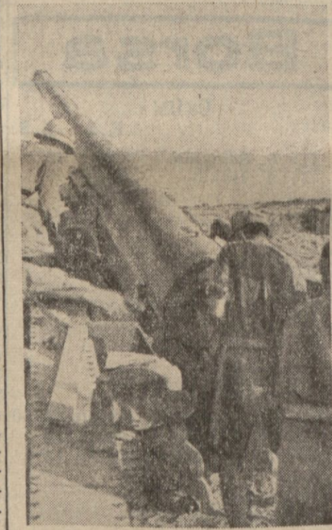
Libyada Mihvercilerin bir bataryası

Berlin, 22 (A.A.) — Tebliğ: Şimal Afrika şumullü büyük hareketler bildirilmektedir. 7 düşman tayyaresi düşürülmüştür.