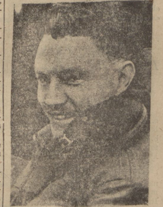
Birmanya yolunu müdafaa edecek olan Amerikan tayyarecilerinden biri

Birmanya yolunu Amerika tayyarecileri müdafaa edecekler