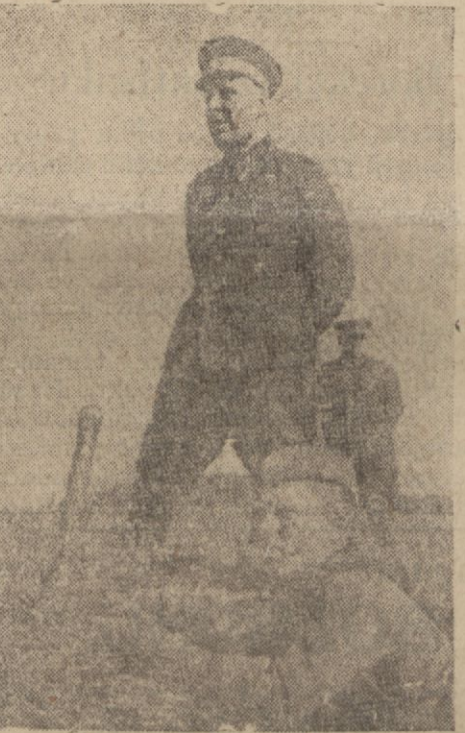
Rostofta bir zafer kazanan Mareşal Timoçenko

İngiliz kuvvetlerinin Bin gazi batısında sahile varmaları mihver kuvvetleri için tehlikeli olmuştur