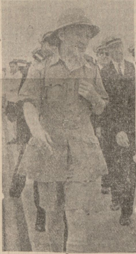
İngilizlerin uzak şark başkumandanı mareşal Bruk Papan

Londra, 15 (A.A.) — Gazetelerin diplomatik yazarları, müttefiklerin askeri plânlarını telif lüzumundan ve bir müttefikler konseyi ihtiyacını — Devamı 3 üncü sahifede —