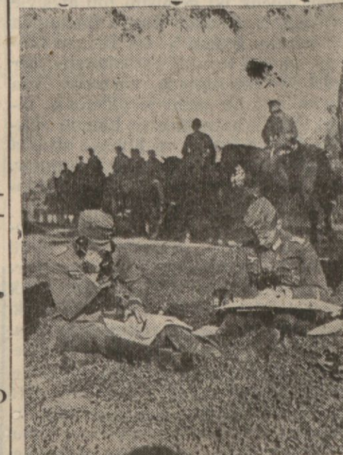
Sark cephesinde Alman kuvvetleri hareket halinde

Bütün cephe boyunca Alman çekilmesi ve Sovyet taarruzu devam ediyor