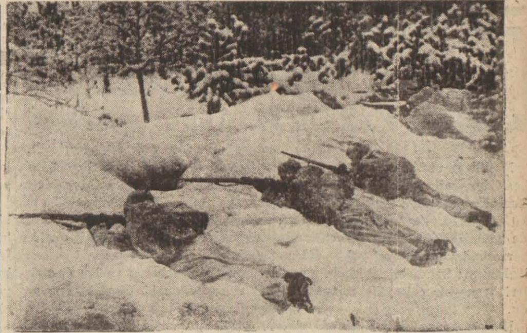
Fin cephesinde gönüllüler...

Bu evlerde oturanlar başka yerlere taşınmışlardır. — Devamı 4 üncü sahifede —