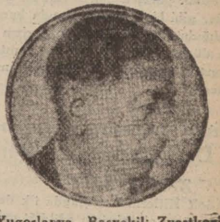
Yugoslavya Başvekilii Zvetković — Siyasi münasebatın tesis edilip edilmeyeceği hakkında söz söylemek henüz erkendir. Demmiştir.

Belgrad, 1 (Radyo) — Yugoslavya başvekilii, Adriyatik sahillerindeki Yugoslav şehirlerini gezmektedir.