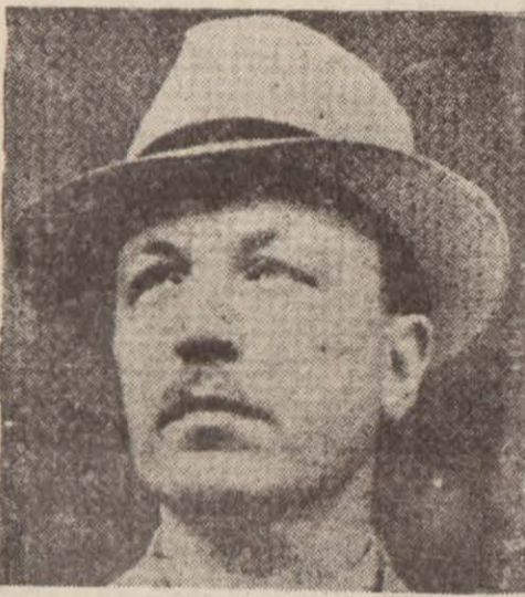
Fin Başvekili Rita

Londra, 13 (Radyo) — Moskova'da imza edilmiş olan sulh muahedesi hükümüne göre, Finlândiyada harp öglesi üzeri saat 11 de durmuştur.