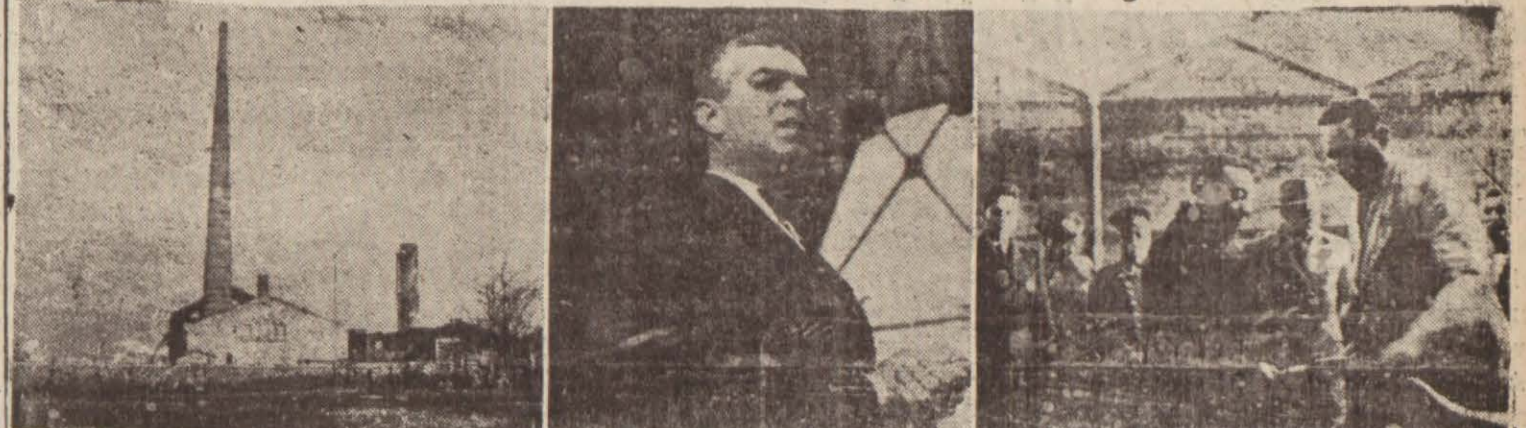
Hava gazı fabrikasının açılma töreninden bir intiba

Bu vesile ile merasim yapıldı ve şehrin kavuştuğu eser takdirler ve tebriklerle karşılandı