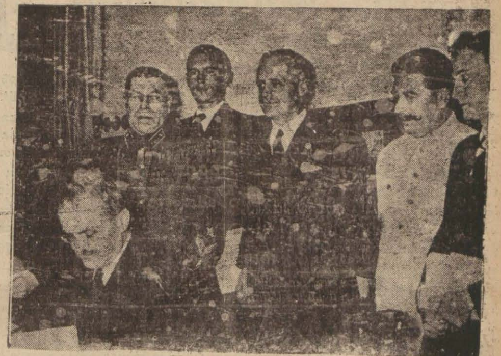
B. Molotof, Rus-Alman anlaşmasını imzalarken..