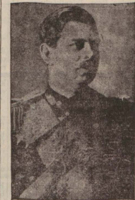
Romanya kralı Karol

Alman taleplerine artık reddedilmiş nazırla bakılabilir