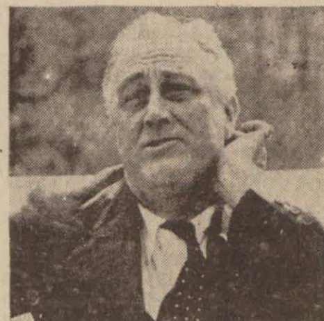
B. Ruzvelt Şimdi ortada yeni bir mesele de

Vaşington, 4 (Radyo) — Vaşington Post; Çemberlaynın nutkundan bahis ile yazdığı bir makalede diyor ki: «Çemberlayn, nazi valdlerine itimatlılık göstermekte haklıdır.