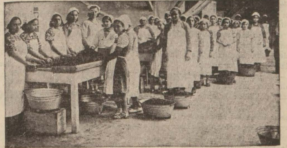
İncir ve üzüm imalâtha nelerinde işçi ve kadınlar

İyi fiatlarla satış beklenmektedir. Havalar da müsait gitmektedir