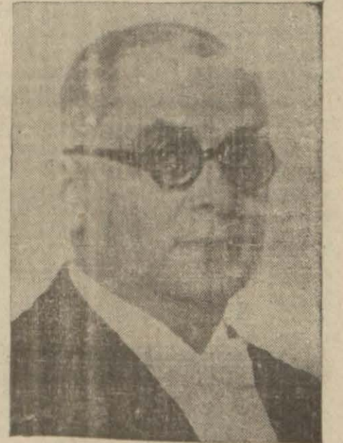
Başvekil Celâl Bayar